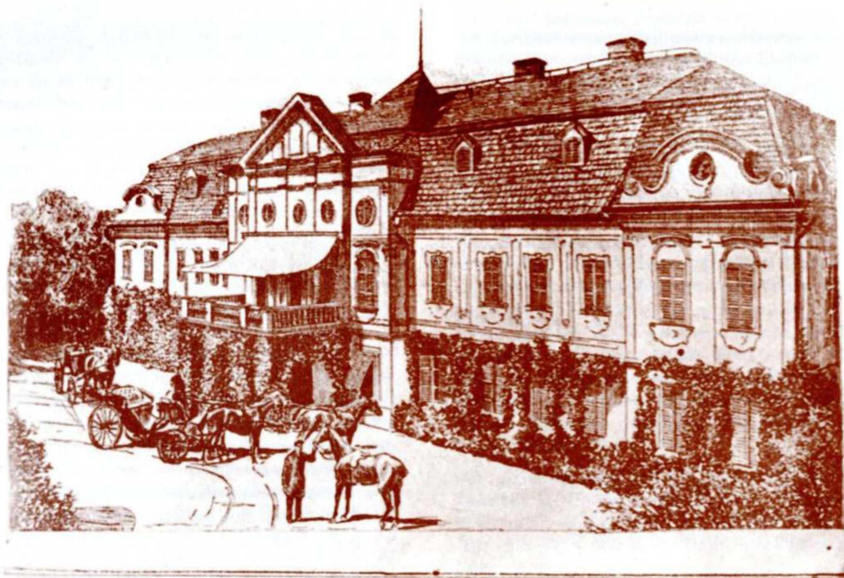
DVORAC GROFOVA JANKOVIĆA U DARUVARU - XVIII. VJEK -

Vormals gräfl. Jankovich'sches Schloss Darüvár im Požeganer Comitatz in Slavonien.