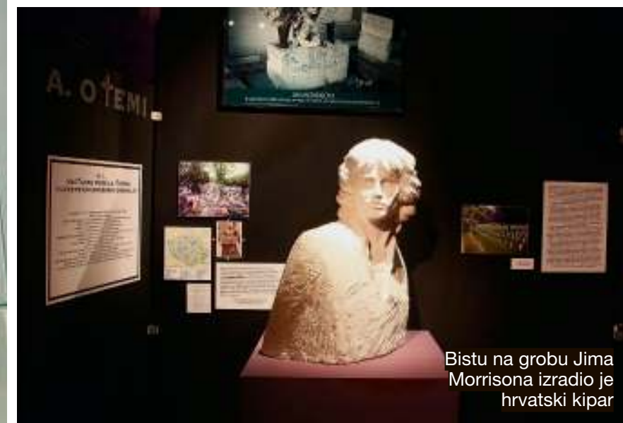
Bistu na grobu Jima Morrisona izradio je hrvatski kipar