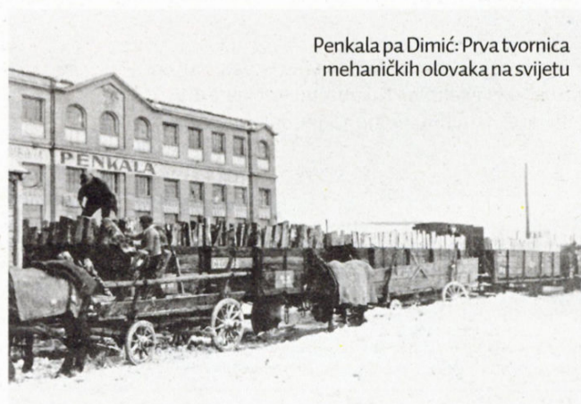
Penkala pa Dimić: Prva tvornica mehaničkih olovaka na svijetu

A ostali objekti? - Želimo pokazati veliki utjecaj koji industrijska arhitektura ima na grad i kako se uklopila u njegovo tkivo danas. Zagreb je, uostalom, bio jedan od jačih industrijskih centara jugoistočne Europe od kraja 19. stoljeća sve do 1990.