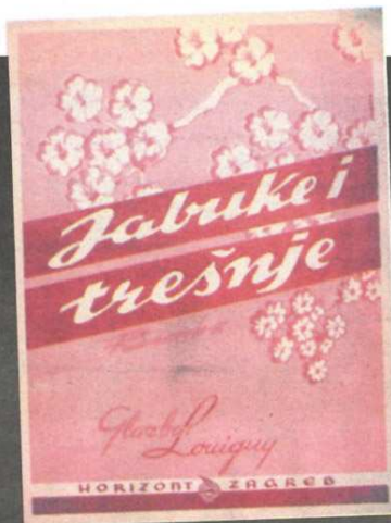
Klavirski separat iz 1952. za 'Jabuke i trešnje'