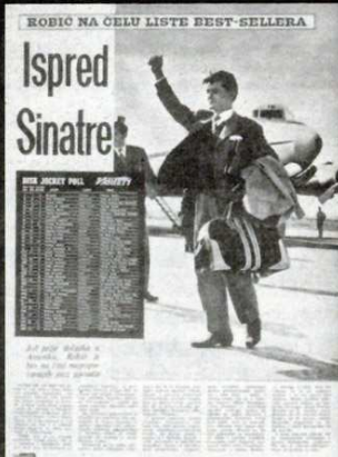
Globus, 25. listopada 1959.