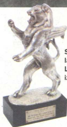
Srebrni lav Radio Luxembourga iz 1961.