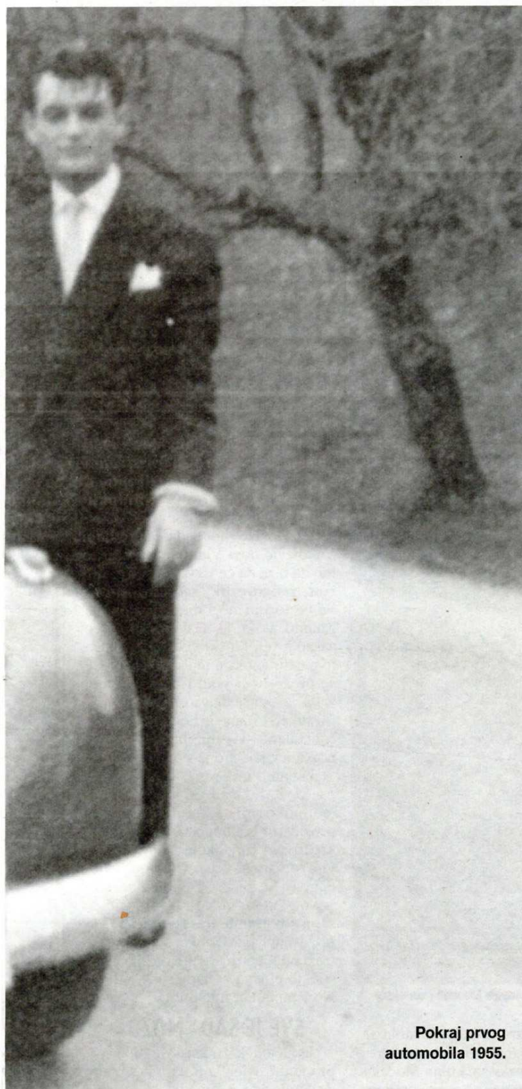
Pokraj prvog automobila 1955.