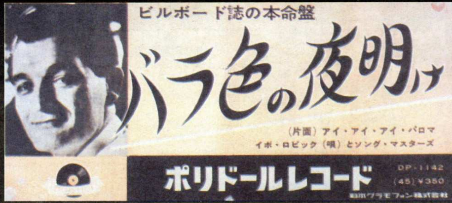
Japanski plakat za 'Morgen', oko 1959.