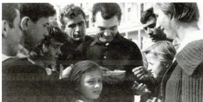
Pjevač s obožavateljima u Opatiji 1961.