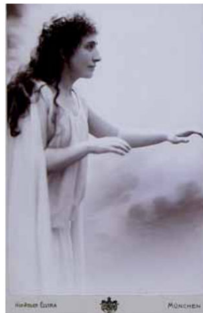
M. Trnina kao Brünnhilde u Wagnerovu Götterdämmerung , München, 1900. Atelier Elvira MGZ fot. 27 103