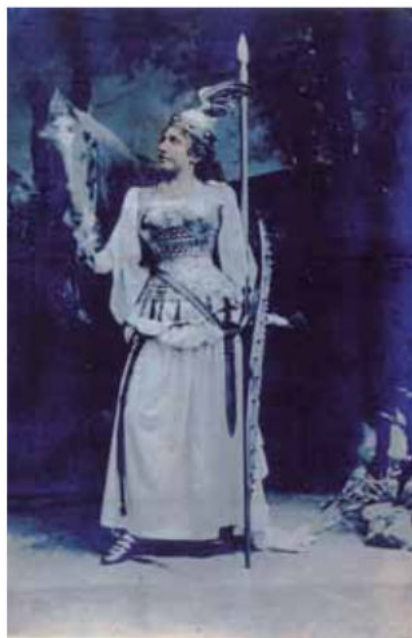
M. Trnina kao Brünnhilde u Wagnerovoj operi Die Walküre , München, 1891. MGZ fot. 19210