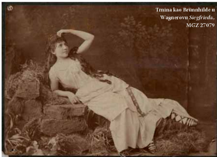
Trnina kao Brünnhilde u Wagnerovu Siegfriedu , MGZ 27079

Vrlo brzo nije više imala smisla i radosti za posjed u Berchtesgaden, pa ga je prodala i odlučila živjeti u Zagrebu. Čeznula je za domovinom i rodnim krajem.