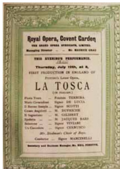
Program za premijeru La Tosca u Londonu 12. srpnja 1900.

U Muzeju grada Zagreba, gdje se čuva najveći dio Trninine ostavštine, posebno mjesto u stalnom postavu zauzima fotografija Giacomina Puccinija s posvetom koja u prijevodu glasi: "Istaknutoj umjetnici gospodici Ternina, idealnoj Tosci Londona sa zahvalnom dušom i s velikim divljenjem pruža Giacomo Puccini, London 13. srpnja 1900."