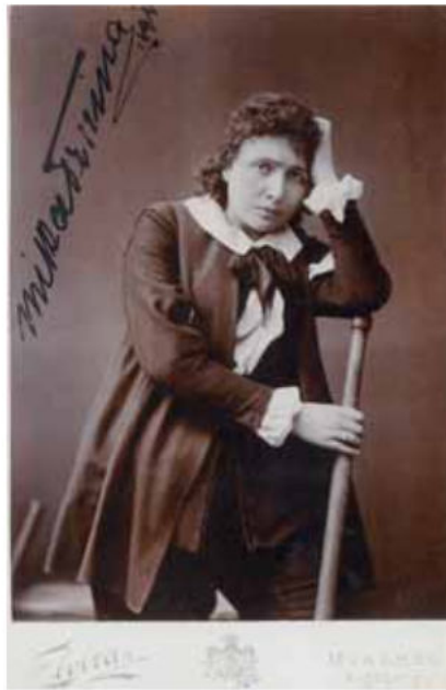
Milka Trnina kao Leonora u Beethovenovoj operi Fidelio , München, 1900. MGZ fot. 38835