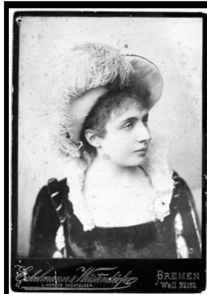
Legenda svoga vremena koja je kasnije našla mjesto u svim svjetskim glazbenim enciklopedijama: Milka Trnina