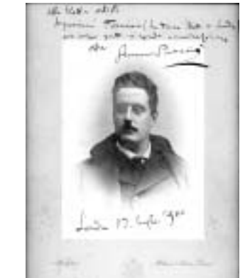
Idealna Tosca: Posveta Giacoma Puccinija

Giacomo Puccini« (Iskrenutoj umjetnici signorini Termini, idealnoj Tosci Londona... Giacomo Puccini). Puccini ju je smatrao najboljom Toscom na svijetu.