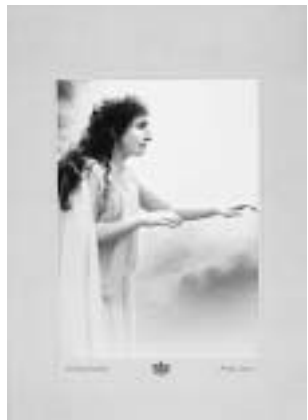
Brunhilda u Wagnerovoj operi »Götterdämmerung«