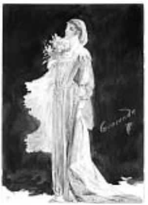
Kostim za Puccinijevu »La Giocondu«