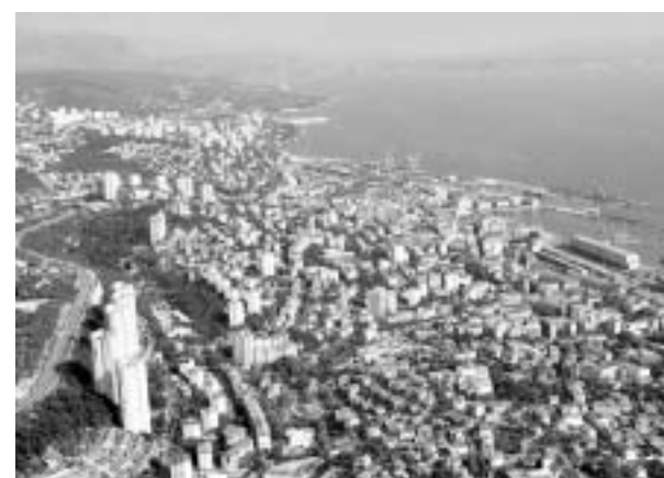
Gradovi 21. stoljeća: Rijeka