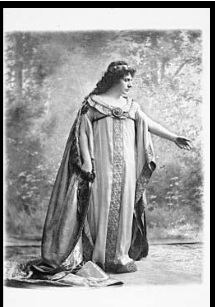
Jedna od najvećih wagnerijanki svih vremena: Milka Trnina kao Izolda u Wagnerovoj operi »Tristan i Izolda«