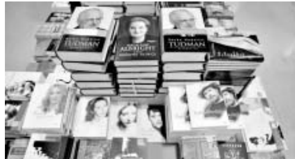
Pravo na pismenost

KOPRIVNICA - Koprivnička Knjižnica i čitaonica »Fran Galović« i Ogranak Hrvatskoga čitateljskog društva, koji pri njoj djeluje, i ove godine obilježit će Međunarodni dana pismenosti 8. rujna, s temom »Pismenost, put iz siromaštva«. Prema podacima UNESCO-a, koji je ustanovio taj dan 1967. godine, 860 milijuna ljudi u svijetu je nepismeno, a više od 100 milijuna djece nema mogućnost školovanja. Stoga je u izlozima knjižnice postavljena izložba tiskane građe »Pravo na čitanje i pismenost pravo je svakog djeteta«, te skulpture čitača u raznim pozama koje su od kaširanog papira napravili polaznici knjižničnih kreativnih radionica. Dan pismenosti proslavit će se i dodjelama nagrada najuspješnijim sudionicima ljetnog kviza znanja, dijeljenjem letaka, besplatnim članarinama i drugim aktivnostima. I time Koprivnica pridonosi »Desetljeću pismenosti 2003.-2012.«, međunarodnom projektu koji je proglasila Glavna skupština Ujedinjenih naroda. [K. R.]