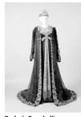
Raskošna: Crna haljina za operu »Tosca«

Zanimljivo je i vrlo rijetko da je na haljini ušiveno i ime krojačice. Na podstavci je ušivena etiketa s natpisom Miss Fisher, theatre costumiere, 22, Bedford st. 8, Covent Garden.