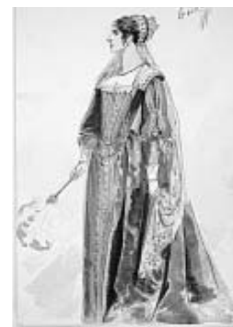
Bogatstvo mašte: Skica Percija Andersona

Percy Anderson (1850. - 1928.) bio je vrlo uspješan britanski slikar i dizajner kazališnih kostima čija se djela čuvaju u Muzeju Viktorije i Alberta, Kazališnom muzeju u Londonu i drugdje. Između 1898. i 1900. Anderson je kreirao atraktivne i osebujne kostime za vrijeme gostovanja Milke Trnina u Londonu. Muzej grada Zagreba čuva Andersonove akvarele koje je radio kao nacрте za Trninine kostime, a sve ih karakterizira bogatstvo imaginacije i kreativnost.