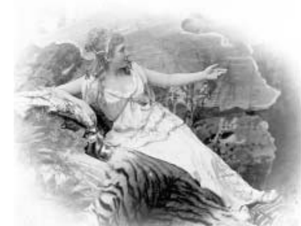
Slavna sopranistica: Milka Trnina kao Venera u Wagnerovom »Tannhäuseru«

U hodnicima u prizemlju Kraljevske opere bit će postavljeno dvadesetak visećih vitrina s izlošcima, originalnim fotografijama slavne primadone u raznim ulogama, privatne fotografije i druge memorabilije. [M. Kalle]