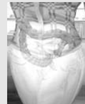
Rad Geralda Davisa

LONDON - Ovih se dana u Kraljevskoj akademiji otvara izložba koju priređuje kolekcionar Charles Saatchi i već je popraćena prvim kontroverzama. Posjetitelji će na ulazu biti upozoreni na eksplicitne seksualne prizore ne bi li se na taj način izbjegao prevelik šok koji bi mnogi mogli doživjeti, a time i uzburkati medije. Među eksponatima će se moći vidjeti novine umrljane spermom, sliku koja prikazuje eksplicitnu scenu seksa i tome slično. Izložba će se moći razgledati do 4. studenog. [T. N.]