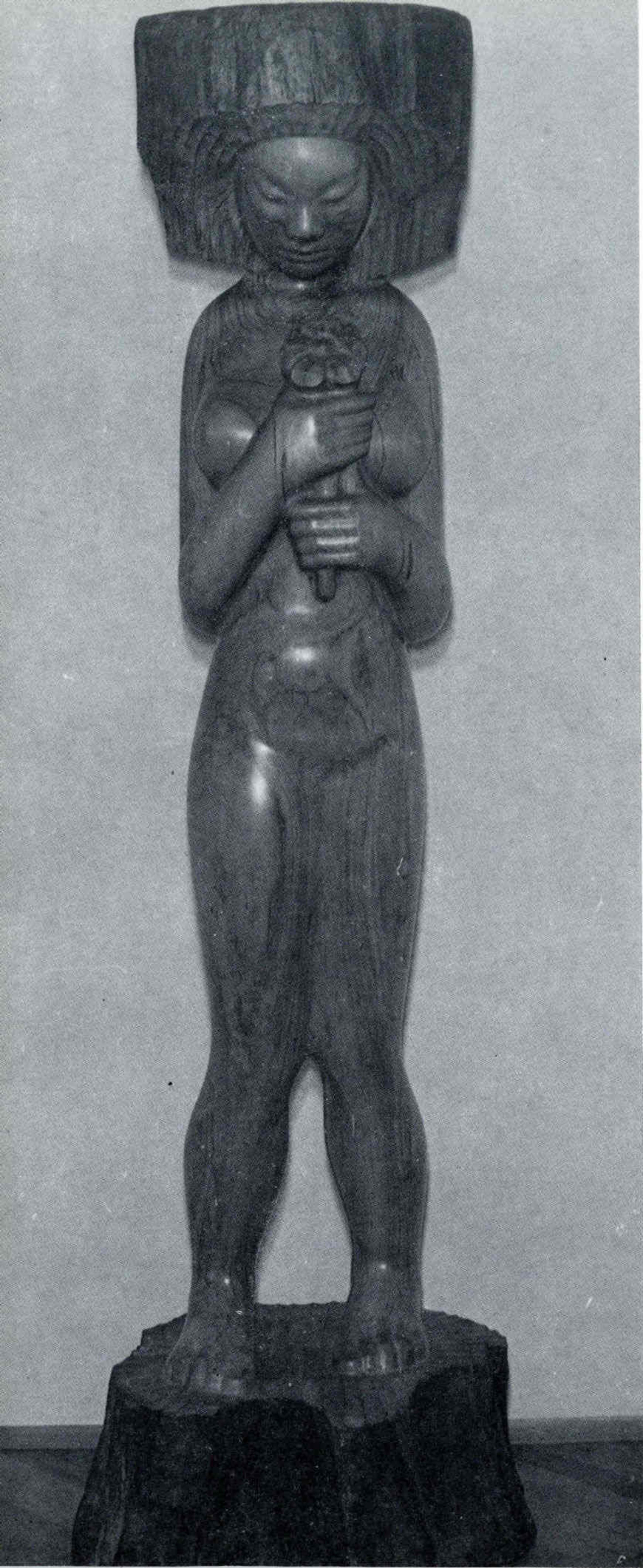
DJEVOJKA S CVIJETOM