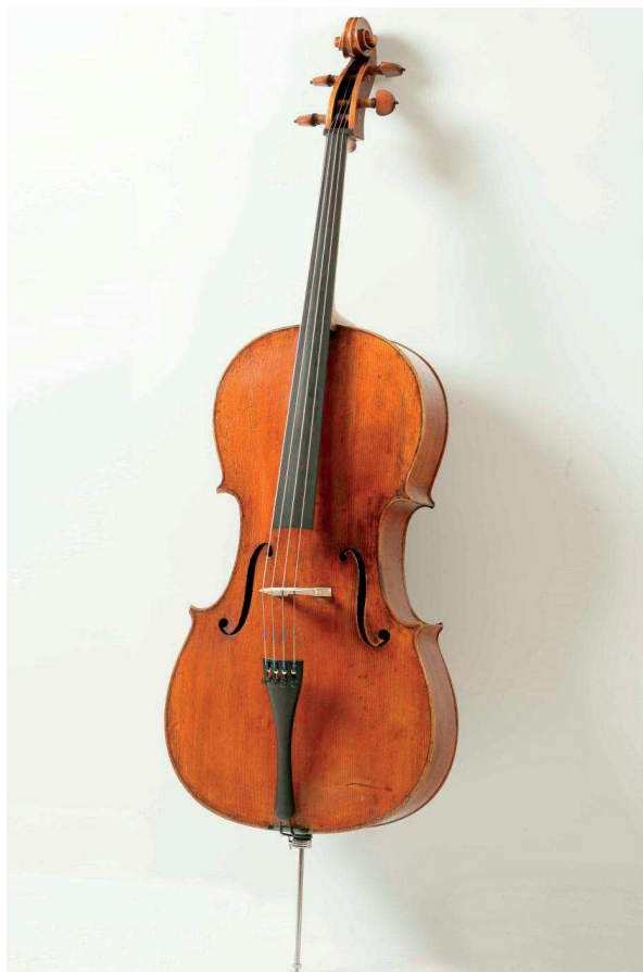
Slika 7. Matzov violončelo s kraja 17. stoljeća

U slikovitom ozračju dnevnog boravka, (slika 8.) oblikovanom u svakodnevnom životu bračnog para, najbolje su došle do izražaja njihove osobnosti. Tu su ih posjećivali bliski prijatelji, u prisnoj su se atmosferi družili i zabavljali gosti njihovih čuvenih domjenaka, a održavali su se i kućni koncerti na čembalu. Čembalo „Neupert“, model Schütz, izrađeno je po narudžbi 1937. godine u Nürnbergu. Margita Matz jedina je tada u nas posjedovala takav instrument. Dio povijesti istaknutog glazbenog para otkrivaju portretne fotografije iz zagrebačkih međuratnih atelijera, fotografije s koncerata i proslava značajnih obljetnica (veći ih je broj snimljen 8. lipnja 1960. na koncertu u Hrvatskom glazbenom zavodu, u povodu 40. obljetnice Matzova umjetničkog djelovanja). Mnoge su ih podsjećale na njihove učenike i studente te prijatelje i kolege glazbenike. Matz je na više fotografija zabilježen sa zborovima i s orke-