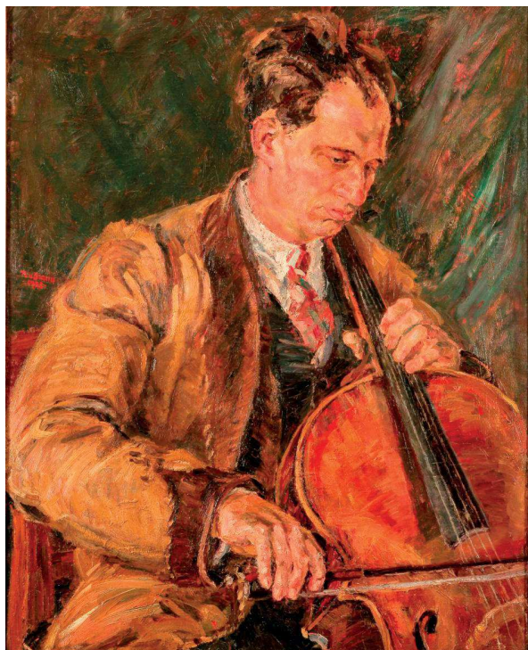
Slika 5. Portreti naslikani 1930-ih godina

drvenom kovčegu, Matzov violončelo s kraja 17. stoljeća, (slika 7.) lijep primjerek majstorskog umijeća građenja gudač-