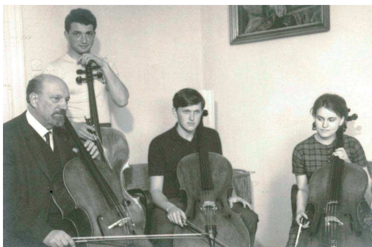
Slika 15. Mladi glazbenici u domu Matzovih

Legendarni dom glazbe ponovno bi se mogao oživjeti uređenjem memorijalne Zbirke. U muzeološkoj koncepciji njene prezentacije dvoje glazbenika približit će se posjetiteljima upotrebom multimedije kao dijela postava. Stan bi tada bio primjeren i za glazbena događanja. Tu bi mladi glazbenici