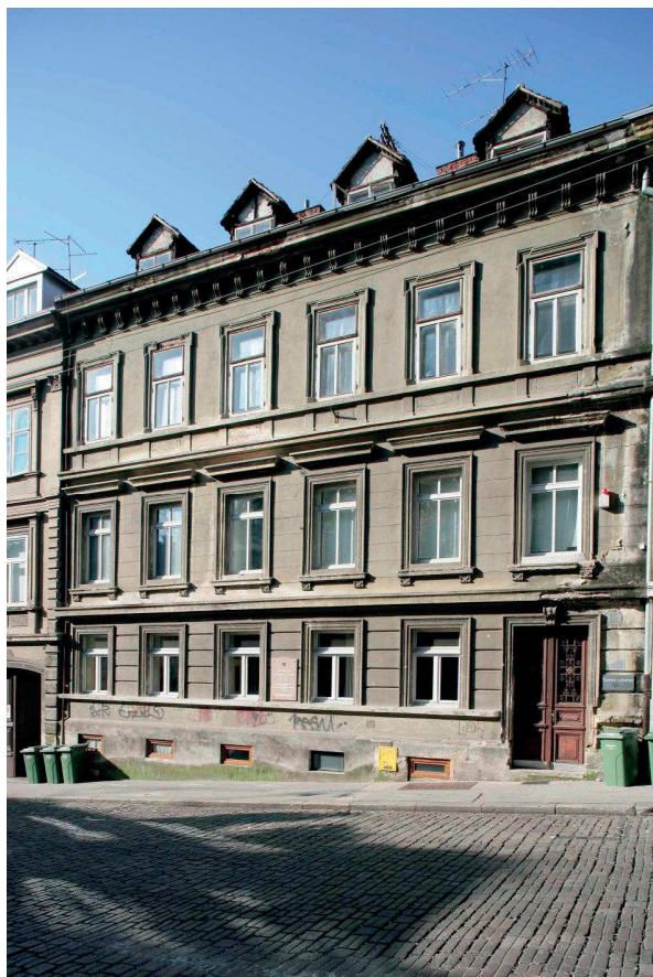
Slika 3. Dom Margite i Rudolfa Matza u Mešničkoj ulici 15

oboje stvarali otkriva njihov bogat i do kraja ispunjen profesionalni i privatni život. Svijet glazbenog para približavaju umjetnička djela i predmeti umjetničkog obrta koji su ih okruživali.