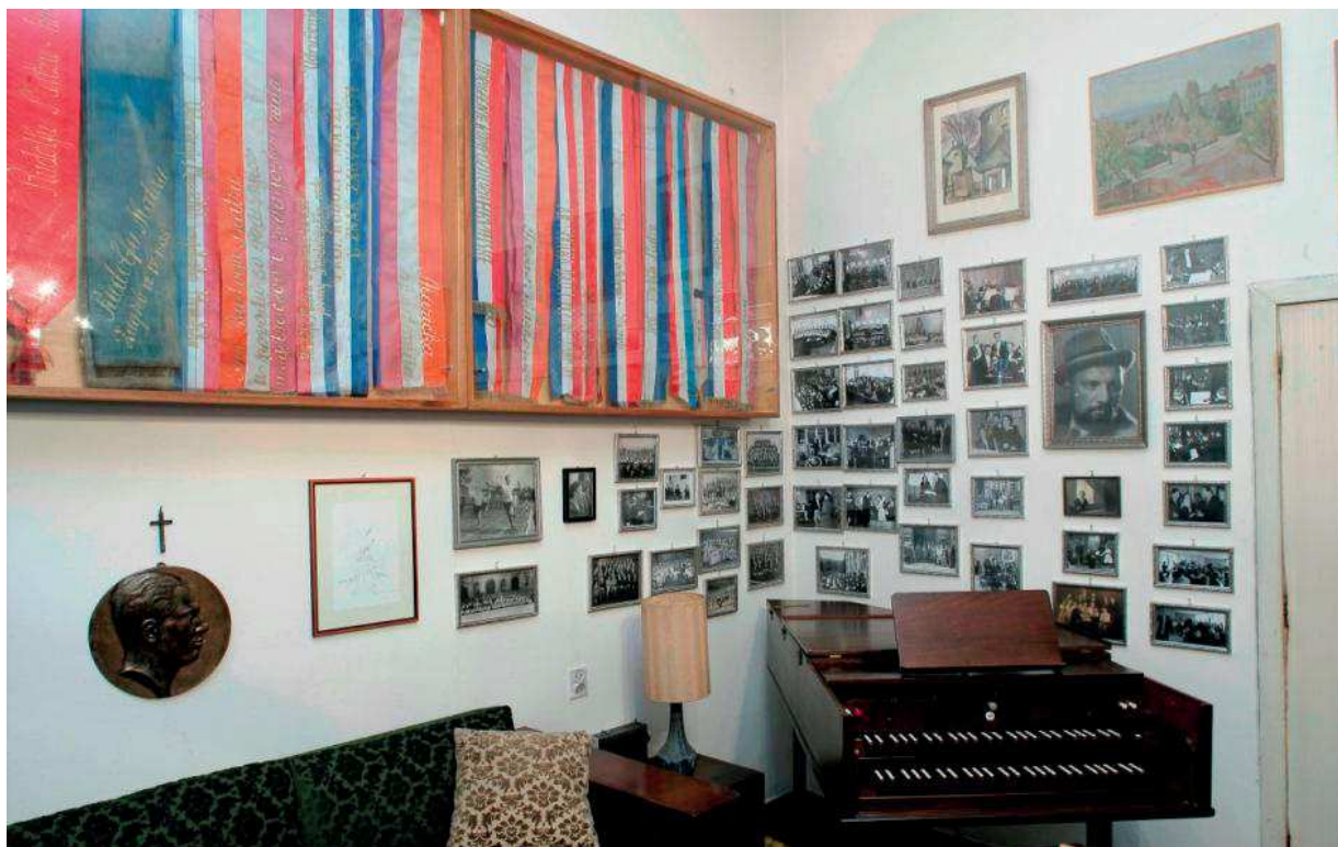
Slika 8. Dnevni boravak

U slikovitom ozračju dnevnog boravka, (slika 8.) oblikovanom u svakodnevnom životu bračnog para, najbolje su došle do izražaja njihove osobnosti. Tu su ih posjećivali bliski prijatelji, u prisnoj su se atmosferi družili i zabavljali gosti njihovih čuvenih domjenaka, a održavali su se i kućni koncerti na čembalu. Čembalo „Neupert“, model Schütz, izrađeno je po narudžbi 1937. godine u Nürnbergu. Margita Matz jedina je tada u nas posjedovala takav instrument. Dio povijesti istaknutog glazbenog para otkrivaju portretne fotografije iz zagrebačkih međuratnih atelijera, fotografije s koncerata i proslava značajnih obljetnica (veći ih je broj snimljen 8. lipnja 1960. na koncertu u Hrvatskom glazbenom zavodu, u povodu 40. obljetnice Matzova umjetničkog djelovanja). Mnoge su ih podsjećale na njihove učenike i studente te prijatelje i kolege glazbenike. Matz je na više fotografija zabilježen sa zborovima i s orke-