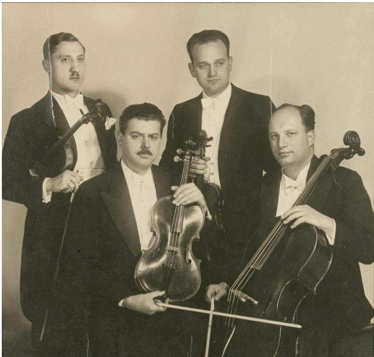
Slika 9. Gudački kvartet „Skład“

strima kojima je dirigirao, a na dvije kao violončelist gudačkog kvarteta „Skład“. (slika 9.) Najdraža mu je bila fotografija na kojoj je uhvaćen kao pobjednik u cilju utrke na 200 m u rujnu 1921. u Pragu. Najstarija u ovom nizu sjećala ga je na briljantnu športsku karijeru. Trenutak za pamćenje iz glazbene karijere Margite Matz je fotografija s njezina prvog koncerta na čembalu, održanog 17. travnja 1939. u Hrvatskom glazbenom zavodu. (slika 10) U Glazbenom studiju među njezinim učenicima klavira bio je Stjepan Radić,