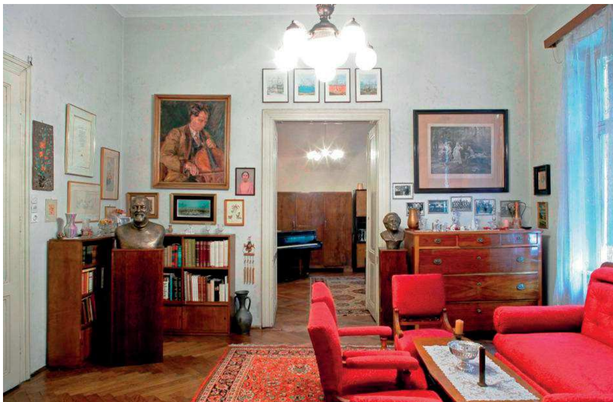
Slika 4. Veliki salon uređen za primanje gostiju; snimio: Goran Vranić

U glazbenoj sobi (slika 6.) važno mjesto imaju instrumenti. Tu je, u starinskom