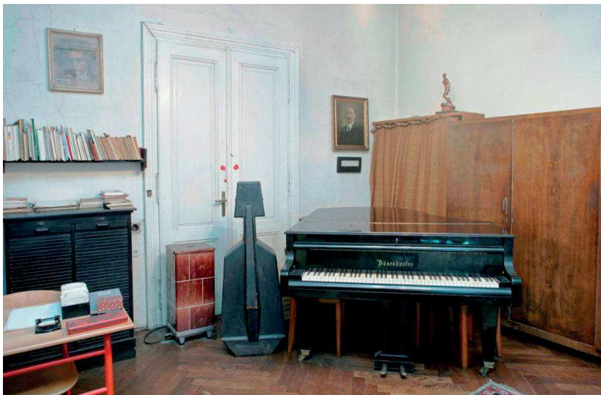
Slika 6. Glazbena soba