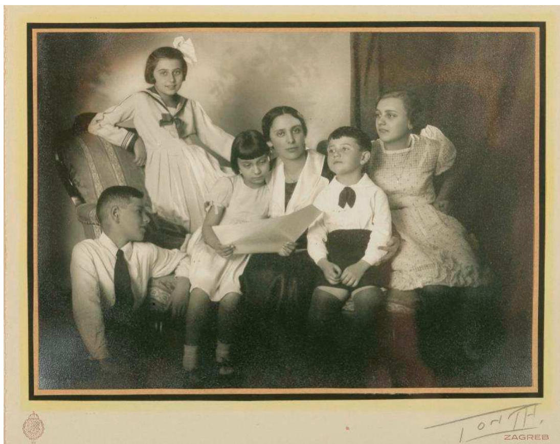
Slika 11. U Glazbenom studiju među njezinim učenicima klavira bio je Stjepan Radić; presnimio: Goran Vranić