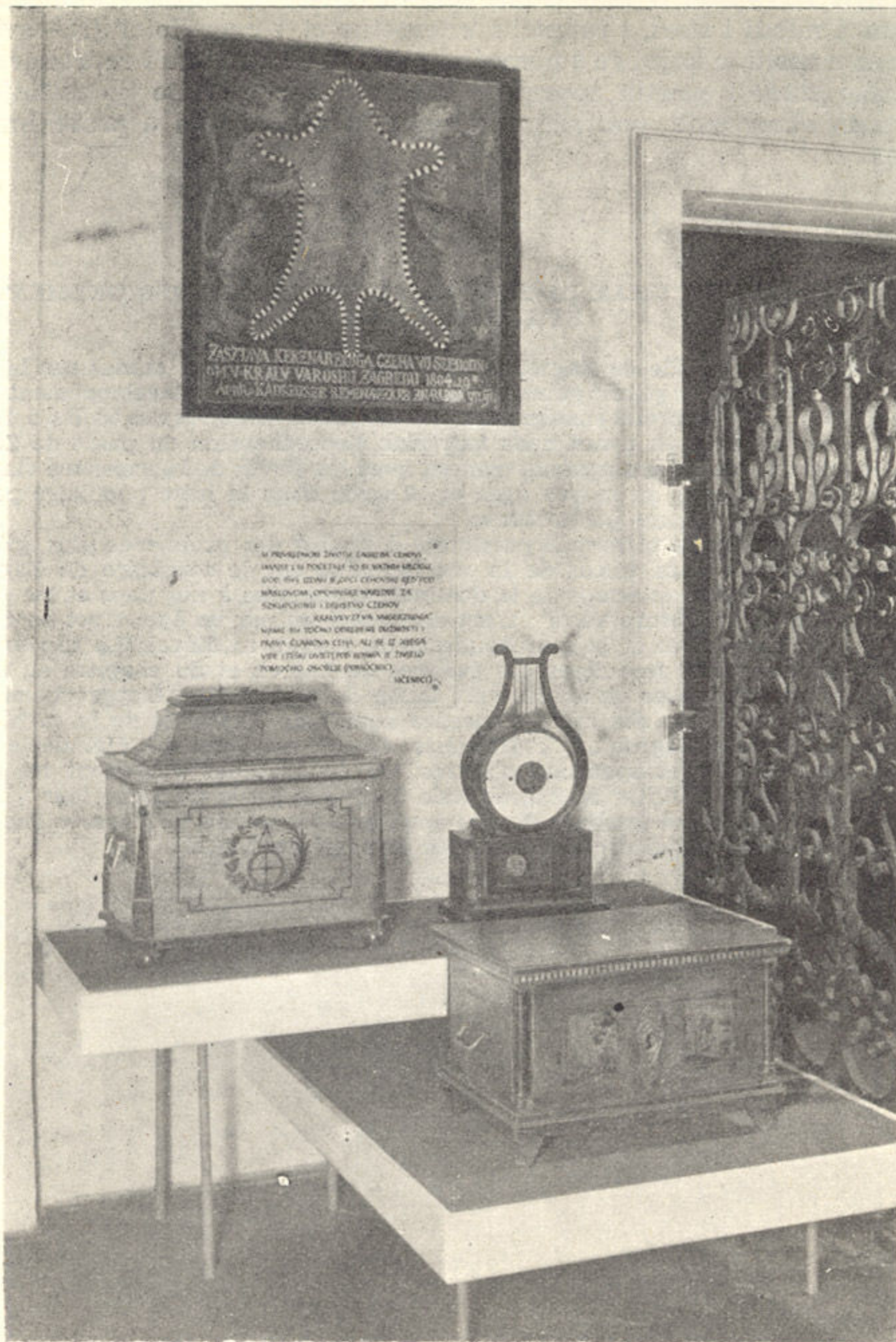
Detalji prikaza Zagreba u 19. stoljeću u Muzeju grada Zagreba