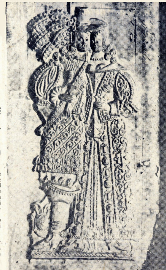
KOLAČ PREMA KALUPU ZAGREBAČKIH LICITARA IZ 18. ST. PRODAVAO SE U MUZEJU GRADA ZAGREBA

Kao što čitalac može vidjeti, spisak je podugačak. Dodamo li tome pojedince koji su svojim nastupom čak dobili i jav-