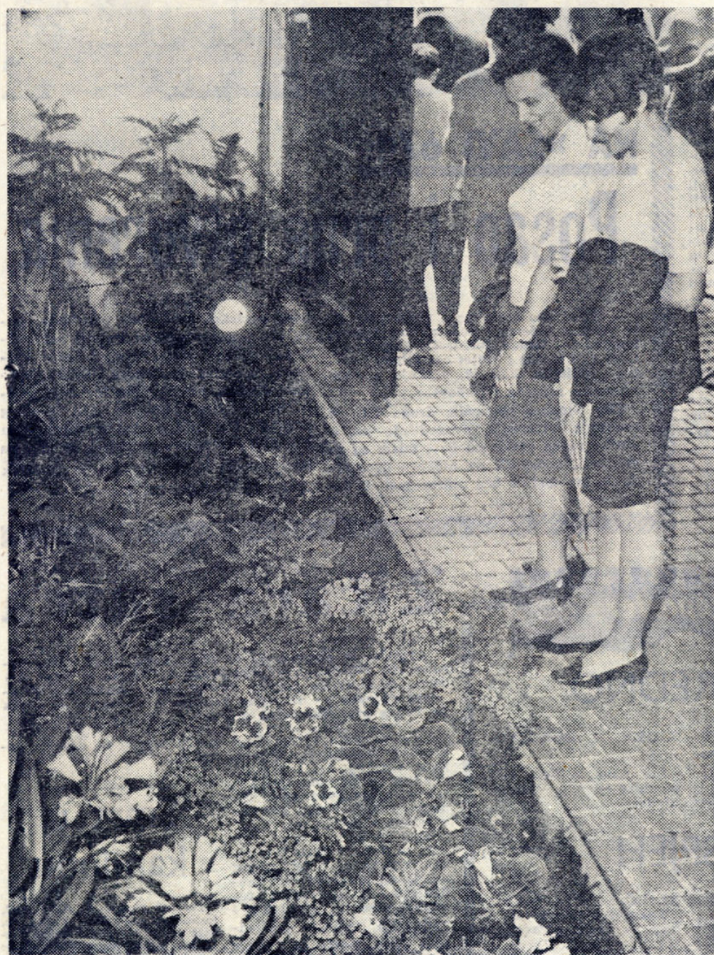
MEĐU BROJNIM IZLAGAČIMA I »FLORA« JE PRIVLAČILA VELIKU PAZNJU POSJETILACA

Drugi sajam cvijeća u Zagrebu pokazao je da se prošlogodišnji fenomenalni posjet ne može pripisati samo novinari. I ove godine upravo bujice ljudi zakrčile su gornjogradske prostore. Doživljavamo pravo čudo u našim okolnostima: veliki repovi ljudi stoje pred vratima kulturnih institucija! Nataložene želje za kulturnim doživljajem, te naše inače pasivne publike, probudene su tako neposredno i tako šokantno da je uspjeh nedvojbjen. Uspjeh i za publiku i za organizatore. Za publiku zato jer je pokazala da joj tehnička civilizacija nije suzila humanitarne horizonte, a za organizatore zato što su pronašli put do srca tog plemenitog čovjeka našeg podneblja. Zvuči čudno, ali je istinito: u vrijeme plaća nekih kulturnih radnika zbog praznih dvorana muzeja moramo ozbiljno misliti o proširenju ulaznih vrata i komunikativnih staza tih istih muzeja, jer su ljudi morali čekati da vide izložbu i po čitav sat!