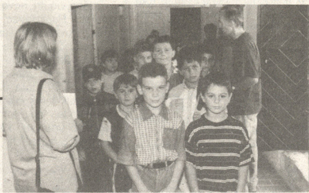
Učenici Osnovne škole Granešina