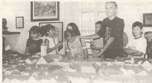
Ovako je nekada izgledao Kaptol