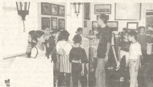
Najveća soba Muzeja, maketa poznatih zagrebačkih građevina

Belin zid je ostao i kao temeljni kamen za samostan klarisa, koji će na ovome mjestu biti sagrađen kasnije.