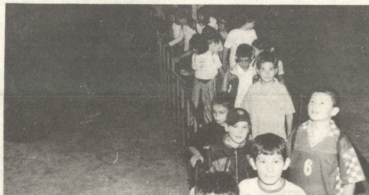
Podzemlje – ostaci nekadašnjih nastambi

Dolazimo do portreta kralja Ladislava i djeca znaju da je on osnivač Zagrebačke nadbiskupije i da je u pitanju 1094. godina. A kad su kod dokumenata, gospodin Čeran im govori i o prvom pisanoj spomenku grada Zagreba, 1134. godine. Na maketi koja pokazuje stanje XVII. stoljeća pokazan je čitav arhitektonsko-urbanistički kompleks: samostan klarisa, (1650), Popov toranj (1247), žitnica (1657) i Nova, kasnije Opatička vrata (XIII st.). S Popovog tornja sada gledamo zvijezde, govori jedna djevojčica, a gospodin Čeran pojašnjava da je uistinu na tom tornju danas poznata zagrebačka zvjezdarnica.