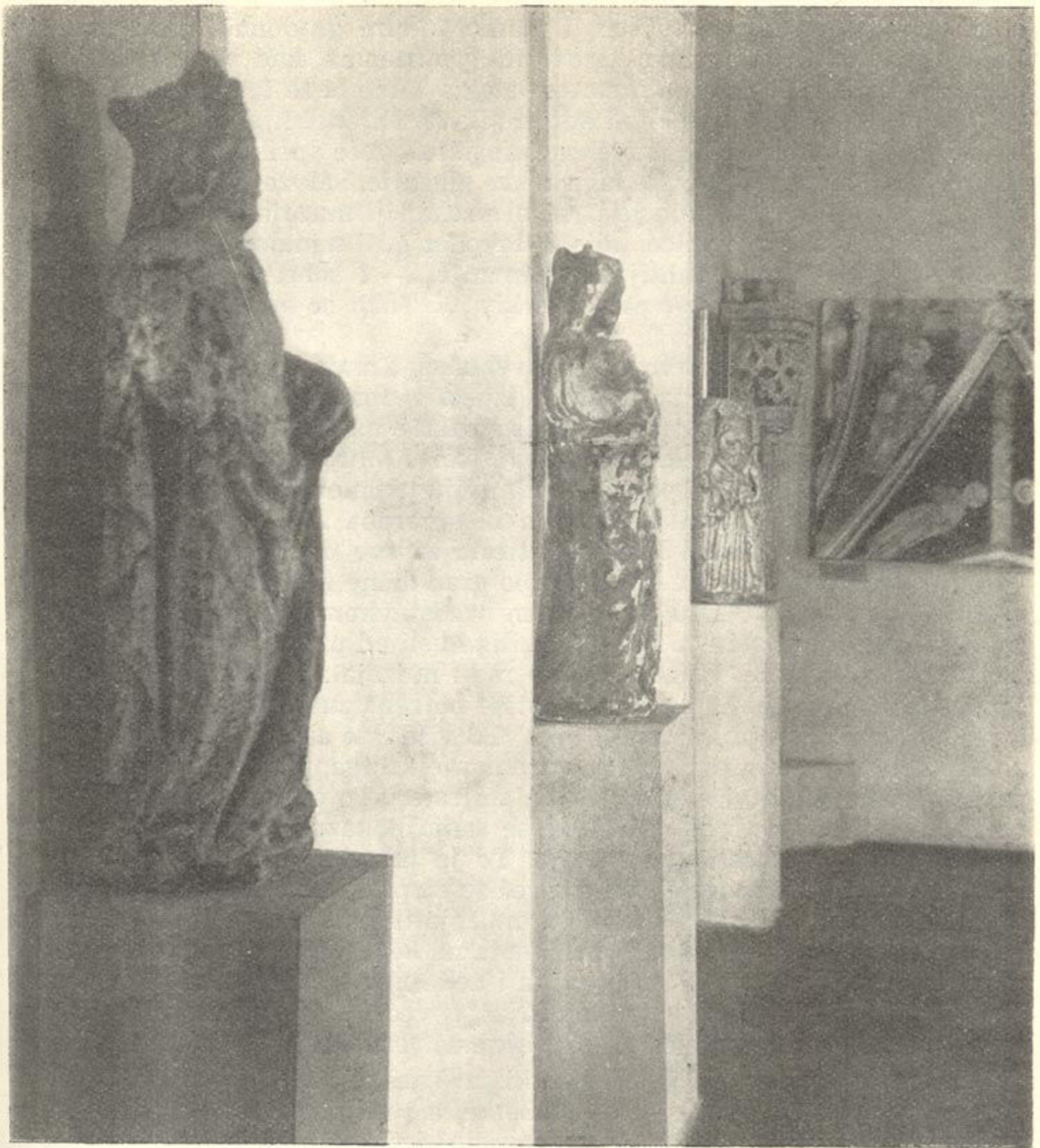
Srednjovjekovna plastika i slikarstvo u Muzeju grada Zagreba

prozorima su drvarnice susjeda i tako je izložen muzej pogibli od vatre. Pak i same prostorije su tako niske, da se oveći predmeti na pr. zastave, valjano izložiti ne mogu«. Bilo je i stvarnih prijedloga za novu muzejsku zgradu. Kao najpodesnija za muzej preporučila se nekadašnja Plemićeva kuća na Dolcu, građevina 17. stoljeća, za koju se mislilo, da je stari cister-