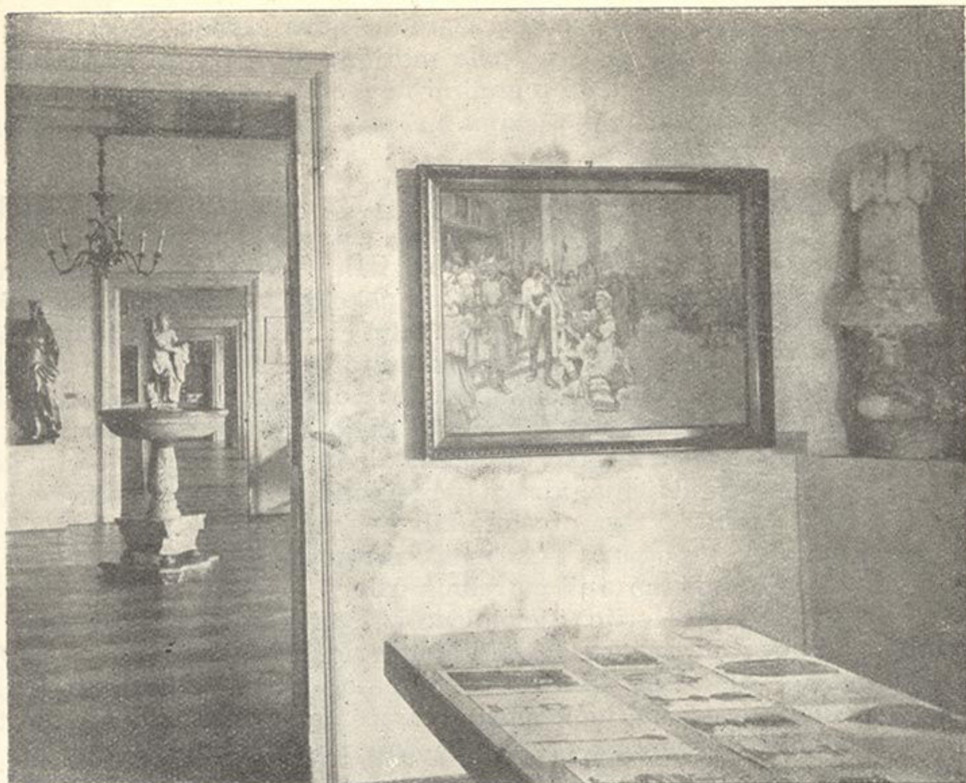
Pogled na izložbene dvorane Muzeja grada Zagreba

nika. Kuratorij će do donošenja statuta Gradskog muzeja voditi sve poslove ovoga muzeja. On se ovlašćuje »da vodi sve tehničke i administrativne poslove Gradskoga muzeja, da odlučuje o nabavi predmeta u okviru raspoloživih dotacija, da stavlja putem Gradskog poglavarstva prijedloge o daljnjem razvoju i usavršavanju muzeja kao i eventualnom preuzeću svih sličnih institucija u pohranu i okrilje, te o eventualnom sjedinjenju takovih institucija s Gradskim muzejem, i da zajedno s Gradskim poglavarstvom izradi konačni statut o upravi Gradskog muzeja i predloži ga Gradskom zastupstvu. Potrebno pisarničko i ino osoblje postavlja gradski načelnik između namještenika gradske općine«. U kuratorij izabrani su privremeno s trajanjem mandata najdulje na tri godine od dana zaključka skupštine osim gradonačelnika Emilije Laszowski, prof. Đuro Szabo i dr. Svetozar Ritig. 59