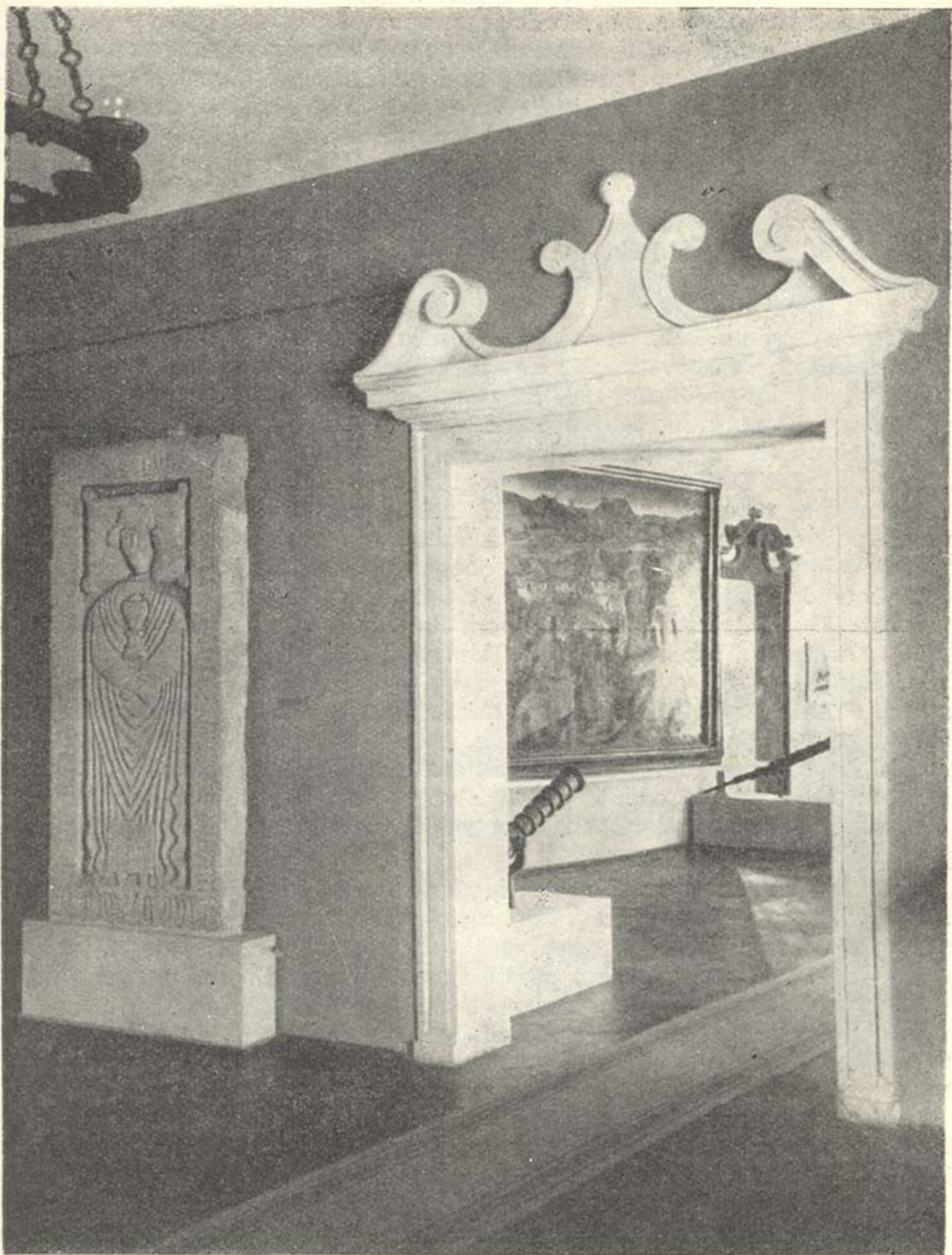
Iz izložbenih dvorana Muzeja grada Zagreba (Opatička ul. 20)