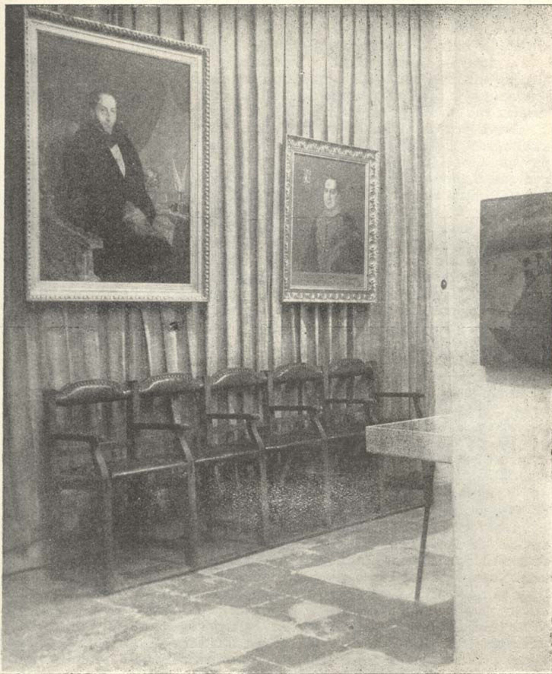
Predmeti iz povijesti zagrebačkog kazališta 19. st. u Muzeju grada Zagreba