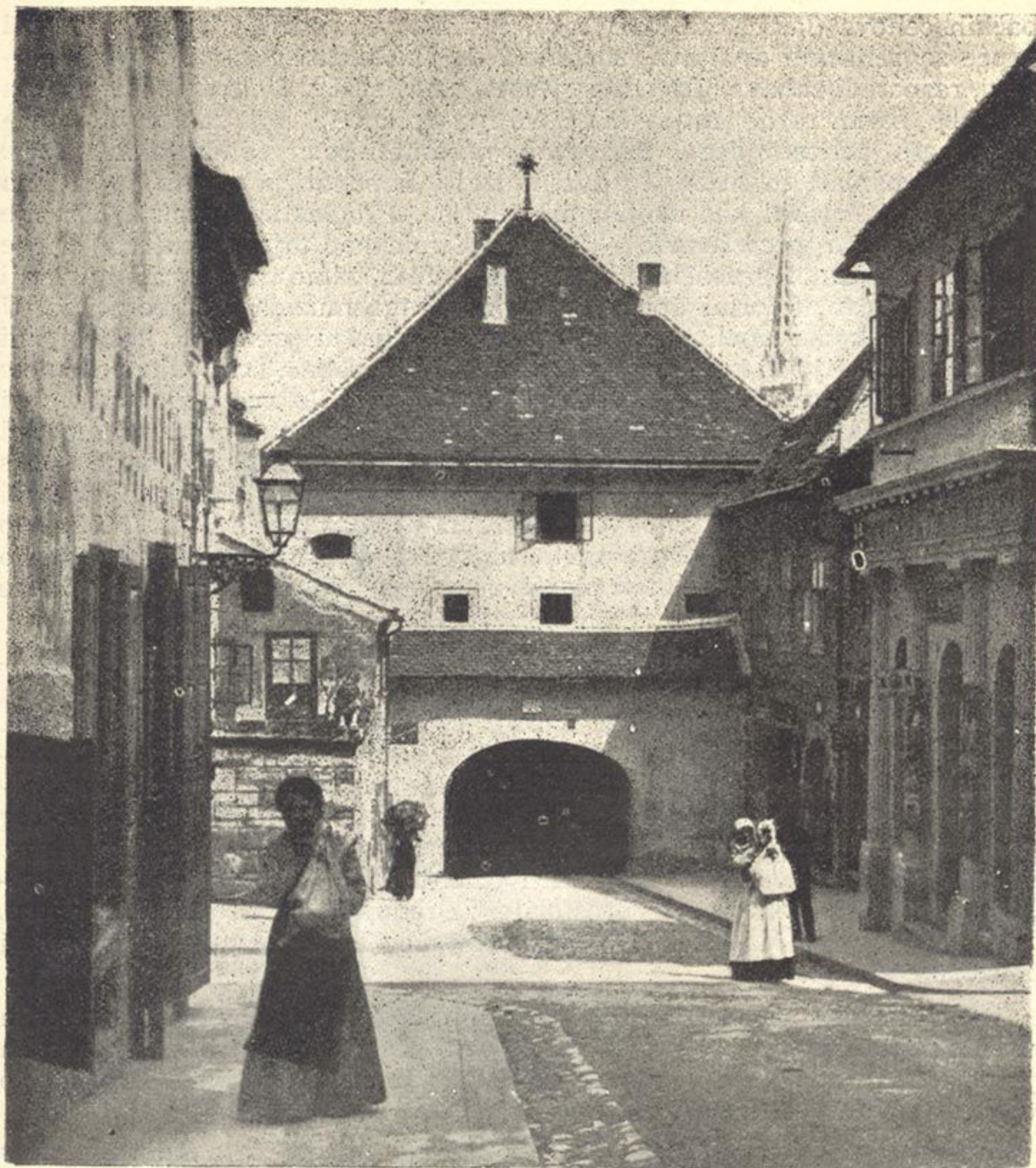
Kamenita vrata. U prvom katu nalazile su se prostorije Muzeja grada Zagreba od 1907. do 1926.

mete izrađene u gradu Zagrebu (bravarske, kovačke, stolarske i druge umjetnine), uspomene na zaslužne Zagrepčane i ostale slavne ljude, koji su u Zagrebu trajno obitavali, starinsko oružje zagrebačke provenijencije, spomenice i spomenkolajne, slike, koje se odnose na historiju grada Zagreba bili to krajobrazi ili portreti slavnih Zagrepčana, predmete zagre-