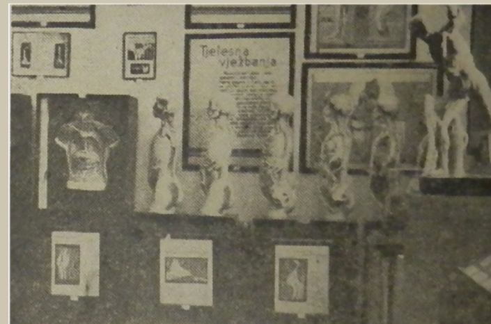
IZ HIGIJENSKOG MUZEJA