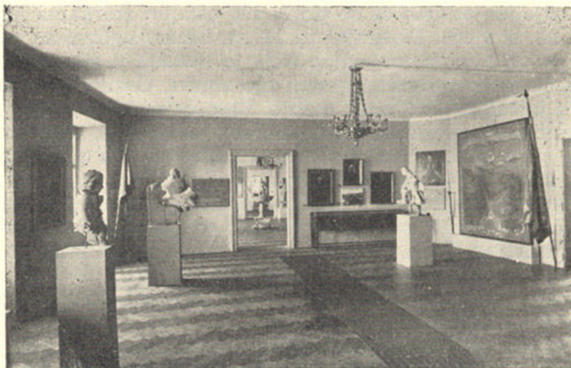
Dvorana VIII. (18. stoljeće) u Opatičkoj ulici br. 20

Borba Gradeca sa Kaptolom i opasnost, koja je prijetila od Turaka u 15. i 16. stoljeću, obrađeni su u daljoj prostoriji. Tu su prikazani i odnos grada i njegove okolice prema Medvedgradu i njegovim silovitim gospodarima, sudjelovanje Gradeca i biskupije u ustanku braće Horvata protiv kralja Sigismunda, zatim sudske i socijalne prilike, pojava prvih cehova i njihovo značenje i uloga u ekonomskom, socijalnom, upravnom i političkom životu grada. Veliki slikani pano daje nam pregled svih najstarijih naselja na području Zagreba, sa oznakom vremena, kad se koje od njih pojavilo u povijesti.