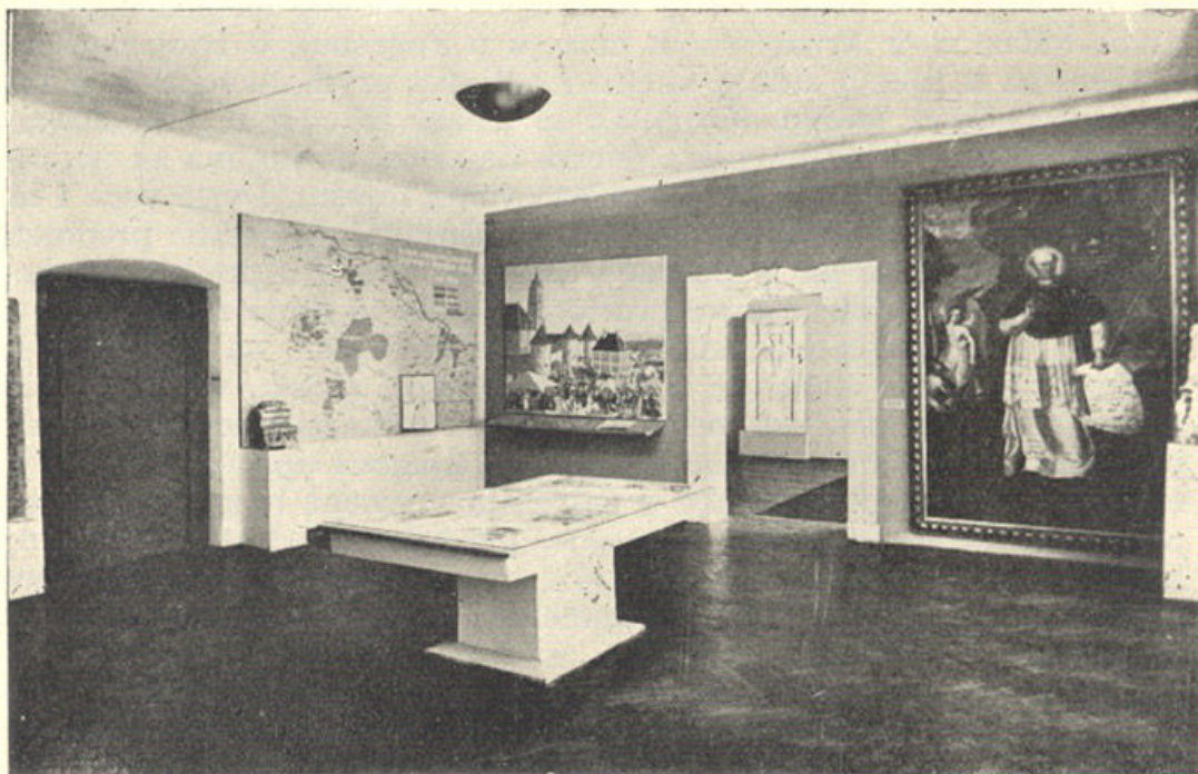
Dvorana III. u Opatičkoj ulici br. 20

U trećoj dvorani prikazani su ekonomski odnosi na području Kaptola. Trgovina i veliki posjedi biskupije i Kaptola, pa najstariji spomenici kulture i umjetnosti, stvoreni i sačuvani u Zagrebu od 13. do 15. stoljeća. I tu se originalne skulpture, arhitektonski fragmenti i slike miješaju s velikim fotografskim povećanjima fresaka iz stare katedrale i kapele nadbiskupova dvora, sa kartom prostranih zemljišnih posjeda biskupije i Kaptola, pa slikom glasovitog »Kraljevskog« sajma na trgu ispred stare katedrale i t. d.