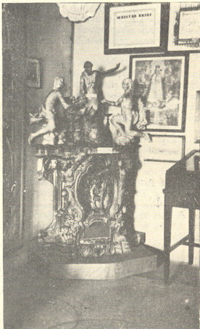
Dio zbirke u Umjetničkom paviljonu

Osnovna značajka Muzeja grada Zagreba u ovoj fazi njegova razvoja obzirom na njegov sadržaj, strukturu i vanjsku formu bila je s jedne strane u tome, što je u njemu bilo izloženo i takvih predmeta, koji su imali vrlo malu ili nikakvu vrijednost i značenje za zagrebačku prošlost, odnosno za kulturno-historijski razvitak grada, a s druge strane, što predmeti u zbirkama nisu bili izloženi po nekom određenom sistemu obzirom na karakter i područje, u koje bi pripadali, niti ih je međusobno, kao ni sa pojedinim bitnim granama života grada, po-