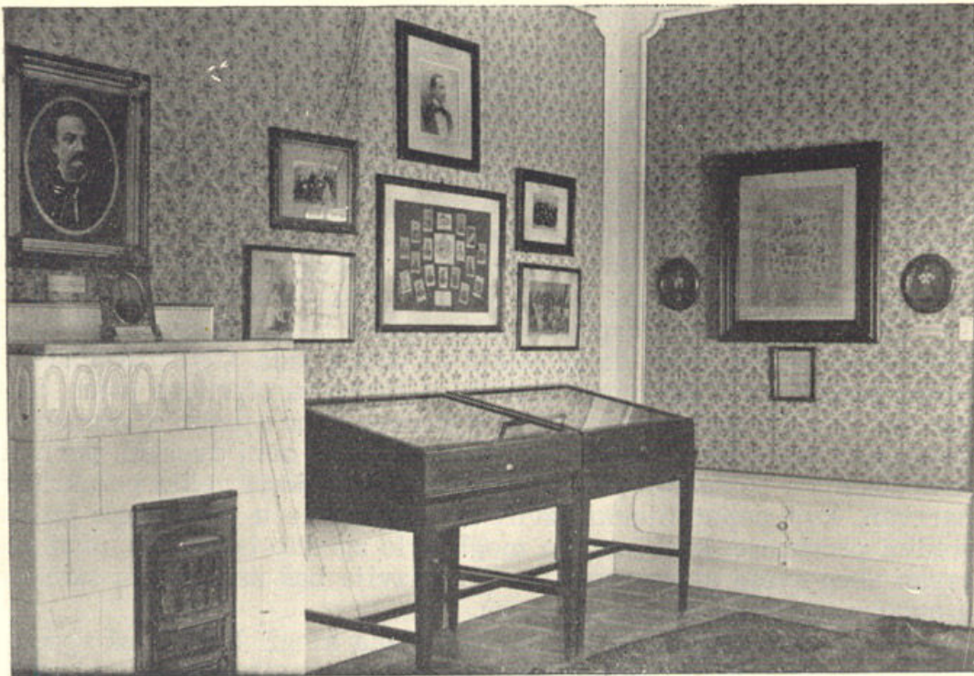
Detalj kazališne zbirke u Opatičkoj ulici br. 8

Da bi prikaz historijskog razvitka bio što potpuniji, a pojedini događaji, pojave i predmeti što zorniji, odnosno da bi se ovi uopće mogli prikazati, upotrebljene su djelomično u novom postavu i ilustracije takvih događaja, pojava i predmeti. One su izrađivane na osnovu historijskih podataka, a svojom zornošću vrlo dobro i korisno ispunjavaju zadatak muzeja u didaktičnom smislu prema širokim slo-