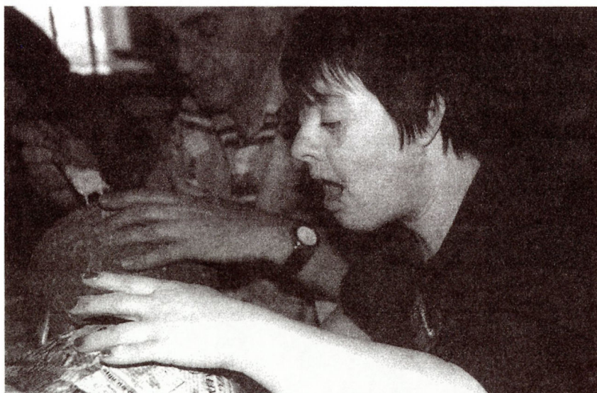
Izrada maski - kaširanje (2001)