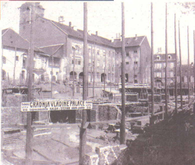
Gradnja Vladine palače, 21. 7. 1908.

Obilježavanje stote obljetnice konceptijski zahvaća čitav raspoloživi prostor MGZ-a. Sadržajan i do detalja osmišljen dijalog s publikom odvija se na trima razinama. Prva u ulaznom dijelu obuhvaća presnimke novinskih članaka o Muzeju objavljene u proteklih stotinu godina. Na drugoj se razini stalni postav uključuje u obljetničarsku izložbu isticanjem objekata koji su u Muzeju od njegova osnutka posebno dizajnerskim legendama. Glavna izložba, naslova duga kao stoljeće, čini treću razinu projekta i postavljena je u izložbenoj dvorani MGZ-a, dakle, ispod greda. Sastoji se od dva dijela: Muzej grada Zagreba tijekom XX. stoljeća i Uz 100-godišnjicu Muzeja grada Zagreba – Nepoznanice . Vremeplov sa zajedničkim nazivnikom mjesta – osobe – kontekst pripovijeda o povijesti muzeja i rastu njegova fundusa, o osobnostima ravnatelja i uvjetima u kojima su djelovali.