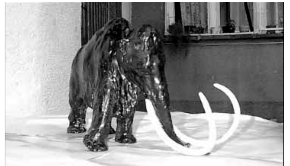
Prijedlog za novi suvenir grada Zagreba: Figurica Vunastog mamuta