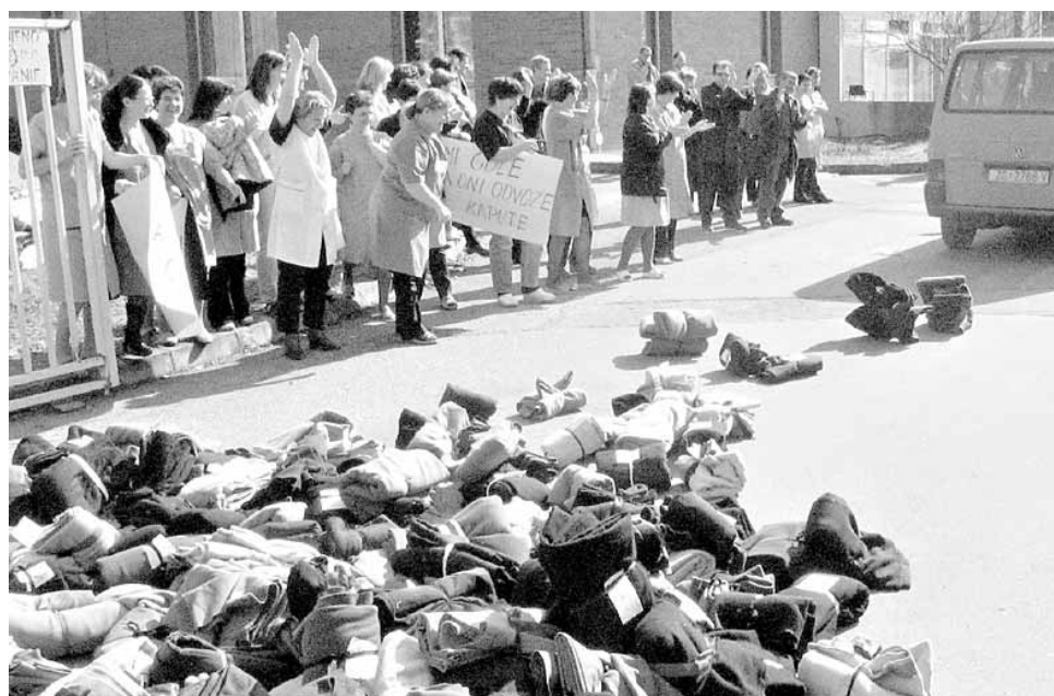
Kamion je s lakoćom pregazio postavljenu prepreku

Radnice Goričanke ismijale su upraviteljicu »poklon«, tj. otpisanu tekstilnu robu, tako da su od nje napravile prepreku protiv kamiona koji odvozi robne zalihe. Kad su vidjele kako je kamion s lakoćom prešao prepreku, same su je uklonile. [R. Đ.]