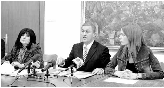
S konferencije za novinare povodom Svjetskog dana voda

»Vodoopskrba i odvodnja trenutno raspolaže vlasti-