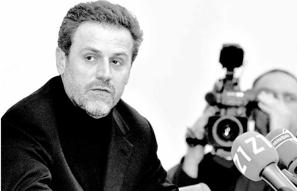
Zamjenik gradonačelnice Milan Bandić na predstavljanju akcije »Slušamo građane 24 sata - za uredniji Zagreb«.

Akciju »Slušamo građane 24 sata - za uredniji Zagreb«, koja će trajati od 21. ožujka do 1. svibnja, organi-