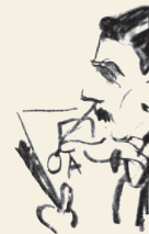
OTTO ANTONINI, AUTOPORTRET SIGNATURA NA ILUSTRACIJI "SILVESTROVO U AUTO-KLUBU" ZAGREB, OBJAVLJENO U TJEDNIKU "SVIJET" 11. I. 1930. GOD. CRAYON

IZ ZBIRKE MUZEJA GRADA ZAGREBA / FROM THE ZAGREB CITY MUSEUM COLLECTION