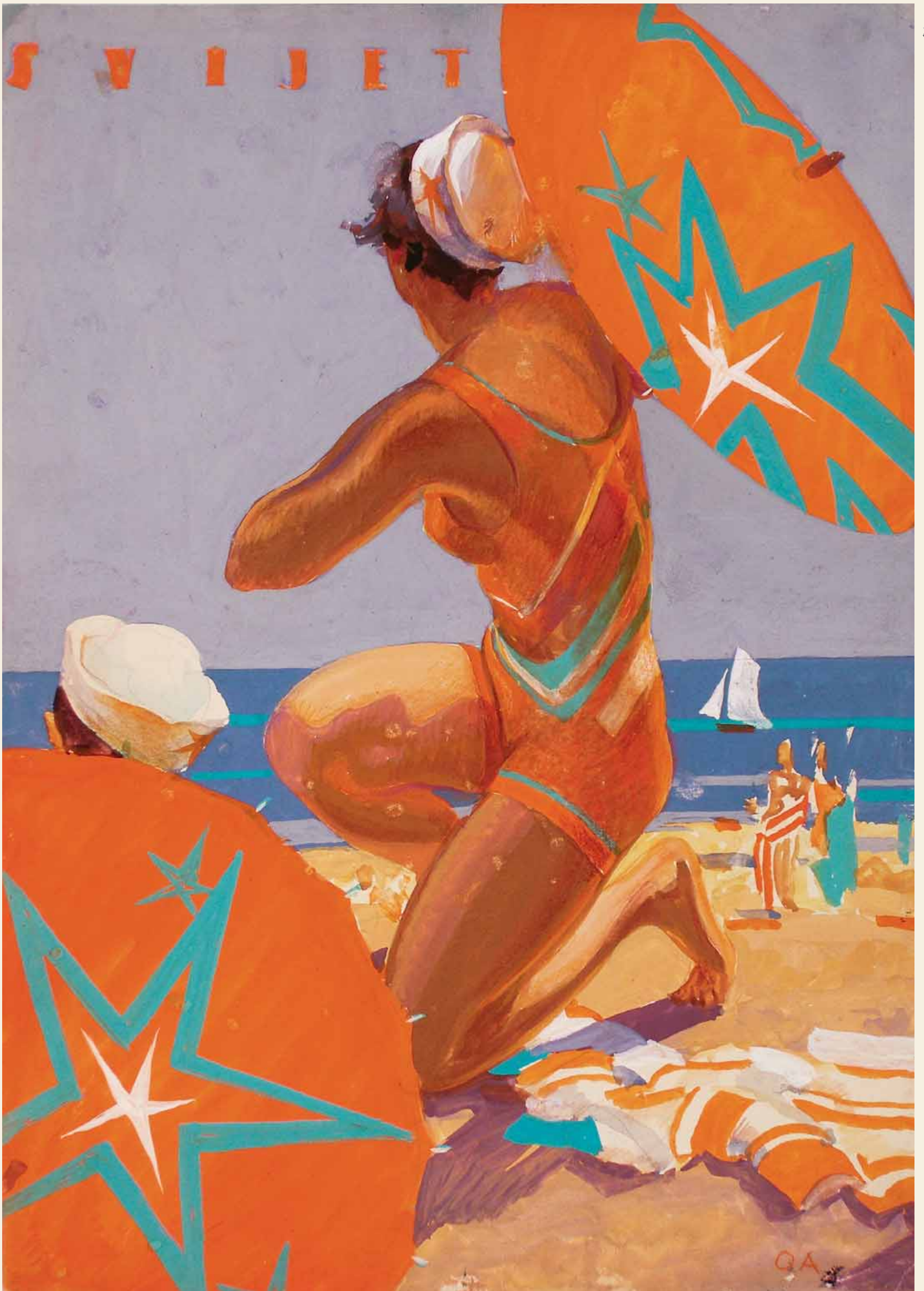
LIJETO / NA MORSKOM KUPALIŠTU | ZAGREB, OBJAVLJENO U TIJEDNIKU "SVIJET" 13. VII. 1929. GOD. | CRTEŽ OLOVKOM, TEMPERA SUMMER / ON THE BEACH | ZAGREB, PUBLISHED IN "SVIJET" WEEKLY ON 13 JULY 1929 | PENCIL DRAWING, GOUACHE