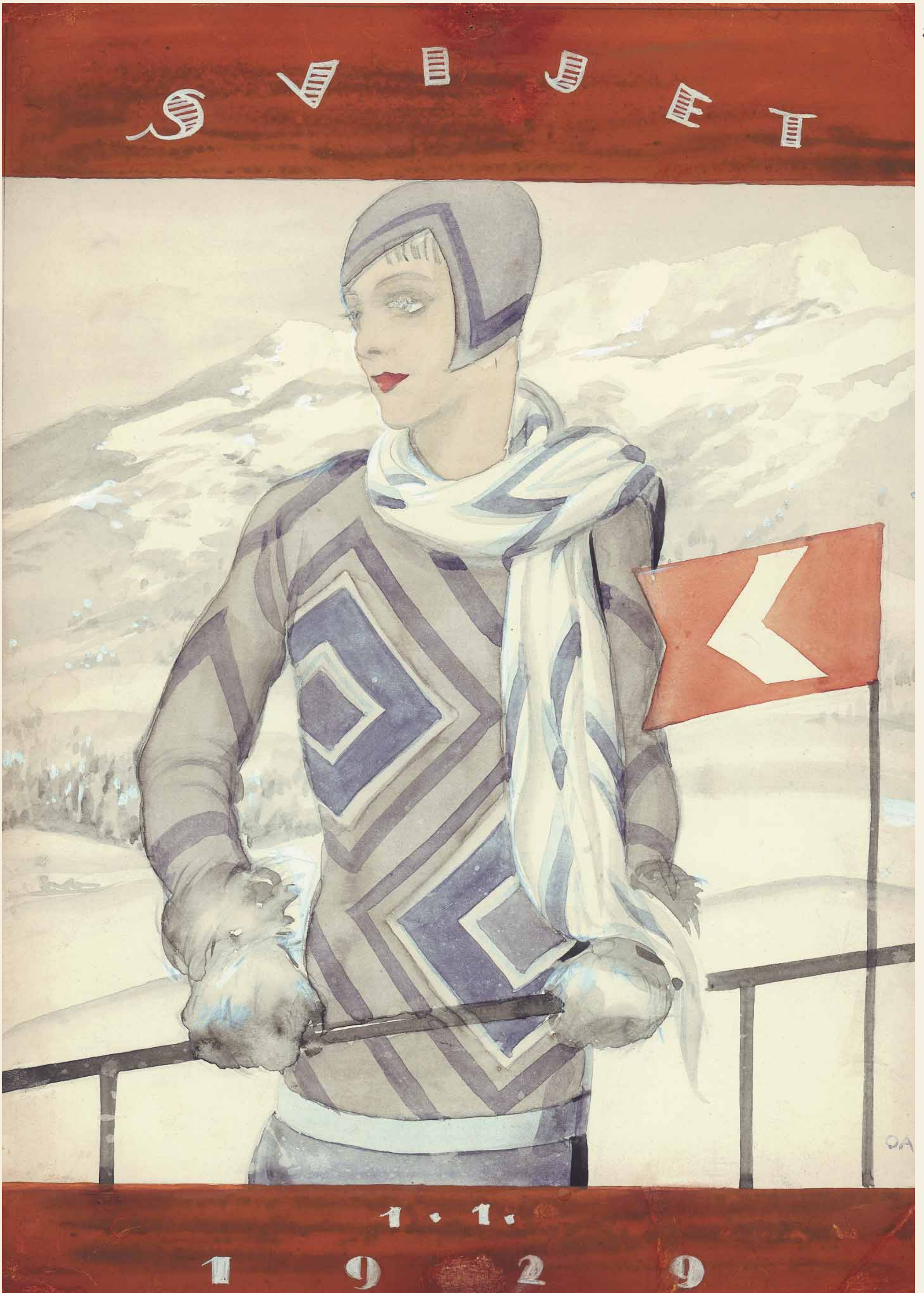
ZIMA / 1. 1. 1929. / DAMSKA MODA ZA ZIMSKI ŠPORT | ZAGREB, OBJAVLJENO U TIJEDNIKU "SVIJET" 1. 1. 1929. GOD. | CRTEŽ OLOVKOM, AKVAREL, TEMPERA WINTER / 1 JANUARY 1929 / LADIES' WINTER SPORTSWEAR | ZAGREB, PUBLISHED IN "SVIJET" WEEKLY ON 1 JANUARY 1929 | PENCIL, DRAWING, WATERCOLOUR, GOUACHE