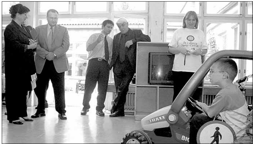
Polaganje »vozačkog ispita« pred ministrima