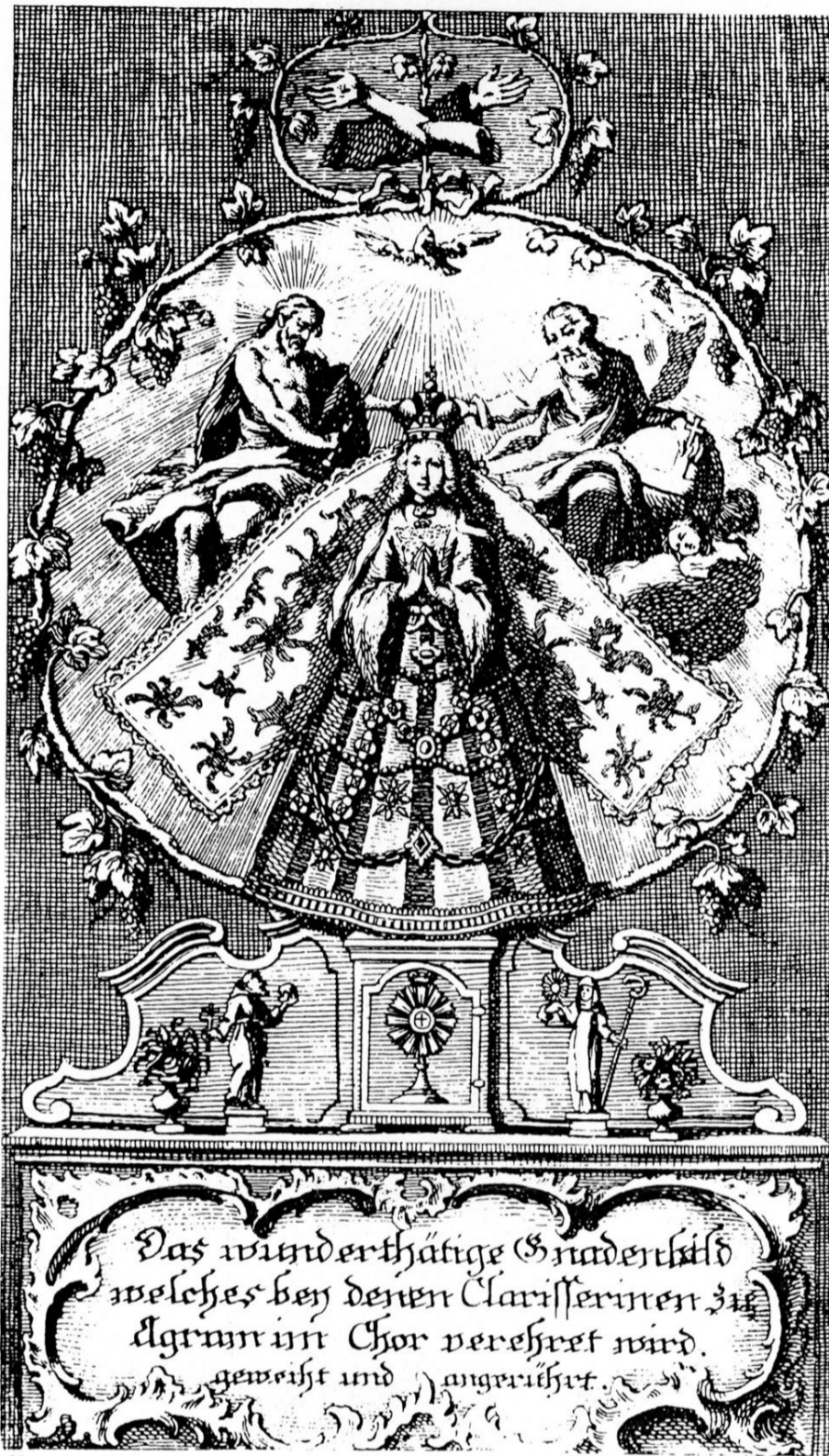
Karica: sv. V. V. V. V.

Kandidatkinje su u samostan uvijek donosile određeni miraz, uglavnom novac, tako da je samostan ubrzo stekao imanja i gotovinu. Gospe opatice su čak posudivale Zagrepčanima novac i živjele od nemalih kamata. Prema strogim pravilima redovničkoga živo-