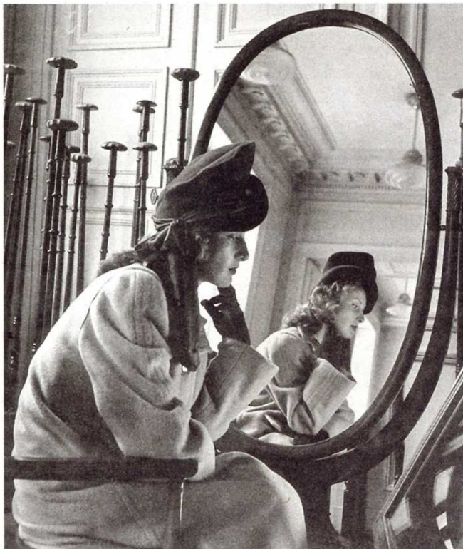
LEE MILLER MODEL SA ŠEŠIROM Lee Miller i sama je godinama radila kao model. Njezin se lik pojavio na naslovnica gotovo svih vodećih modnih magazina

Lee Miller odlučna je doći na studij u Pariz kod jednog čovjeka: slavnog Mana Raya. Iako Ray slovi kao težak čovjek i premda je u početku odbija, Miller je svjesna svoje neodoljivosti i ubrzo se njihovi umjetnički, ali i ljubavni životi isprepleću. Kao muza i ljubavnica zamjenjuje slavnju kabaretsku pjevačicu Kiki de Montparnasse