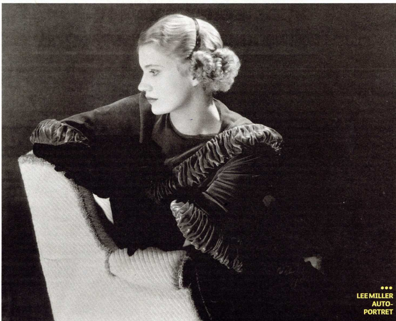
LEE MILLER AUTO- PORTRET

Život i jedne i druge bio je krajnje uzbudljiv i nekonvencionalan. Obje su, zapravo, preživjele nekoliko života u jednom, a onda se iznenada i nenajavljeno odlučile povući. Velike umjetnice bile su dugo zaboravljene, a sada se vraćaju velikim izložbama. Piše Patricia Kiš