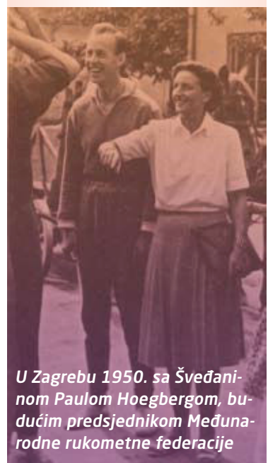
U Zagrebu 1950. sa Švedanom Paulom Hoegbergom, budućim predsjednikom Međunarodne rukometne federacije

Formerly one of the best European hazena athletes, she was a state team representative in several sports and later a prominent sports official.