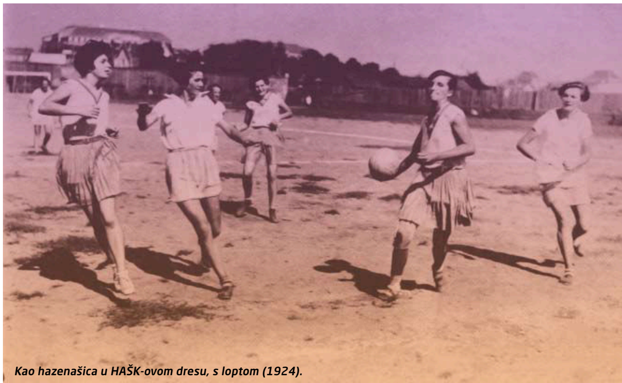
Kao hazenašica u HAŠK-ovom dresu, s loptom (1924).