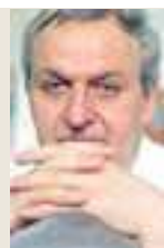
Piše: Boris LJUBIČIĆ

Olakšanje zbog završenog posla, otplaćenog kredita, izliječene bolesti, to su oni primjeri koje ima svatko od nas. Loše je ako ih imamo sve odjednom, bolje ako ih ima manje, a najbolje ako ih ni nema