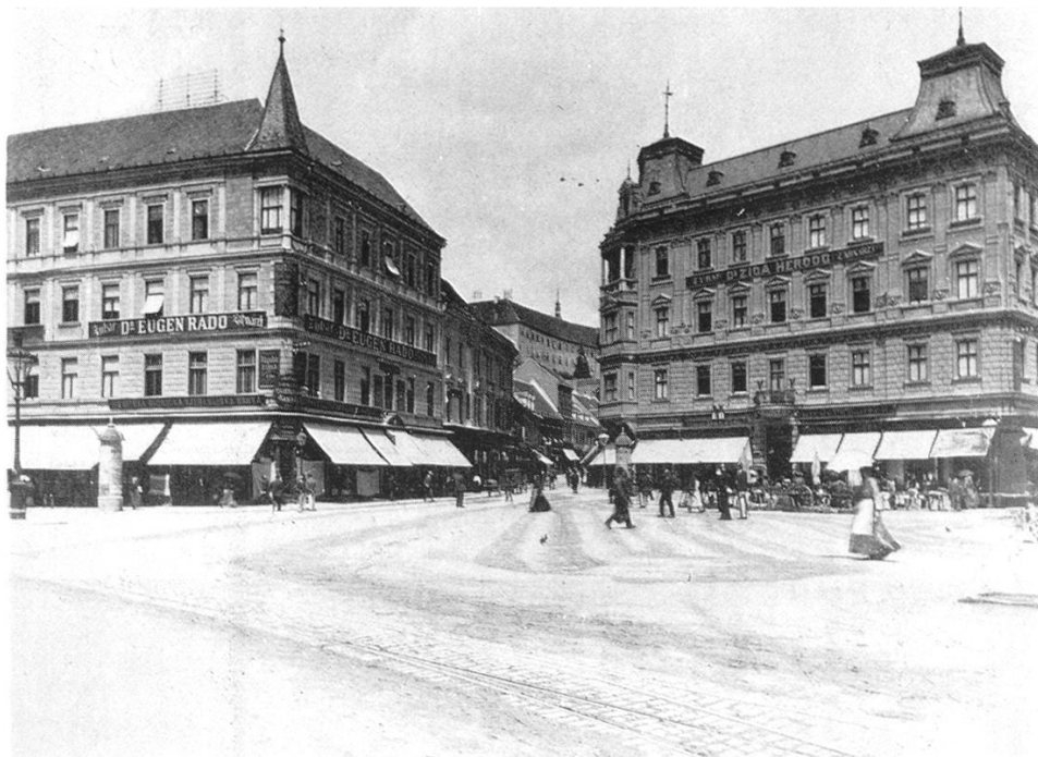
PALACA PONGRATZ (srušena) NA JELACIĆ TRGU (DANAS TRG REPUBLIKE)