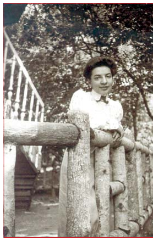
Draga prijateljica: Dora Pejačević u objektivu Elizabete Drašković