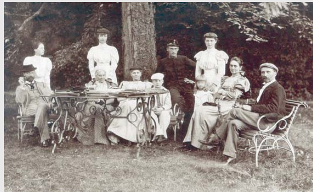
Plemstvo na ladanju: Grupni portret obitelji Hellenbach-Drašković iz 1898.