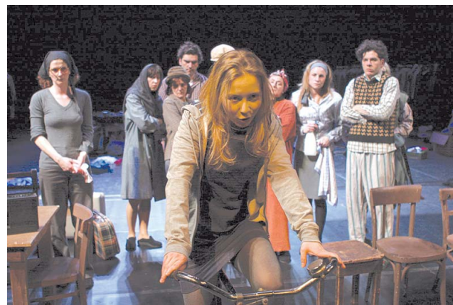
Zavidnom razinom zajedništva zadivili žiri: Ansambl »Crna« riječkoga HNK-a

Festivalska je publika za najbolju predstavu izabrala »Različita mišljenja« britanskog dramatičara Davida Harea, u režiji Neve Rošić i izvedbi Talijanske drame riječkoga HNK-a. [J. M.-M.]