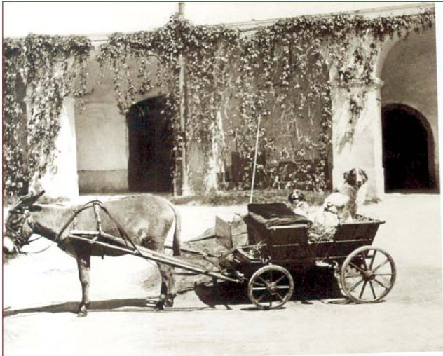
Obijest: Zaprega s magarcem za pse

od Trakošćana te manji dio što ih je načinila Gysella von Hellenbach. Elizabeta iz dana u dan snima život u četverokutu Bisag (gdje živi na raskošnom obiteljskom imanju), Zagreb, Graz, Beč (kamo zalazi) u vremenu između 1898. i 1917. Pedantna fotografkinja sve je popratila potpisima i komentarima iz kojih se iščitava vrijeme, mjesto i likovi na slici, posvete.