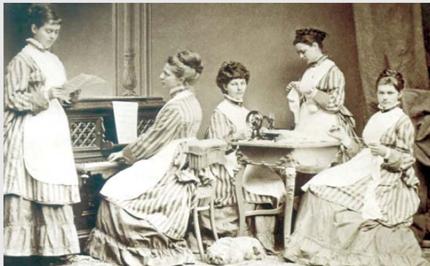
Ženski poslovi: Pet kćeri obitelji Hellenbach u kućanskim djelatnostima