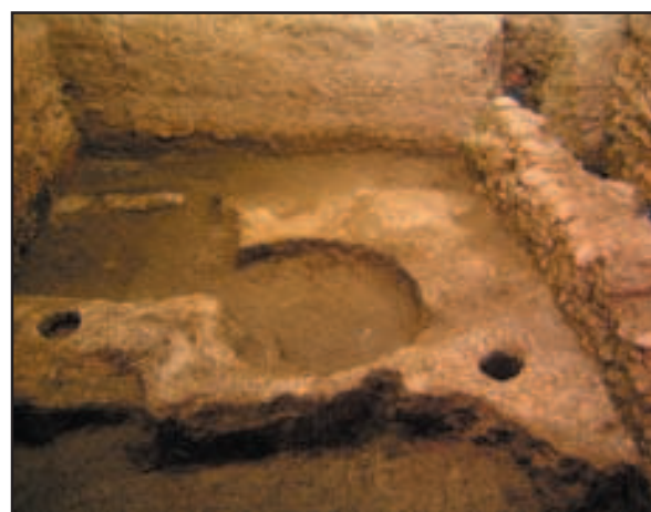
Gornjogradska gimnazija, pogled na bedem i istraženi dio učionice

Tijekom arheoloških istraživanja otvorena je sonda u središnjem dijelu prostorije kako bi bili definirani slojevi vezani uz srednjovjekovni bedem koji se, u smjeru istok-zapad, protezao kroz južni dio prostorije. Bilo je očito