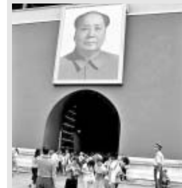
Poznati Maov portret