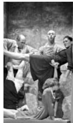
Iz koreografije Inbal Pinto

U sklopu programa održat će se i četiri plesne radionice koje će voditi međunarodni koreografi, a nakon predstava u Festivalnom klubu u kazalištu »Gavella« predviđeni su razgovori s izvođačima. I ove godine dodjeljivat će se nagrada publike, a posebne nagrade pripast će i trojici sretnih gledatelja. [Sonja Tešinski]