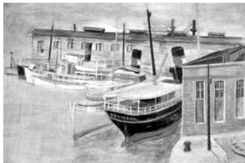
Riječka veduta: Rad Vilima Svečnjaka

Ali za razliku od većine »Bojan Z« njezine elemente uklapa u svoj osebujni glazbeni jezik s pokrićem – nosi ju u svojim genima – što rezultira uvjerljivim izvedbama. Osjetila je to i publika izmamivši ovacijama dodatak.