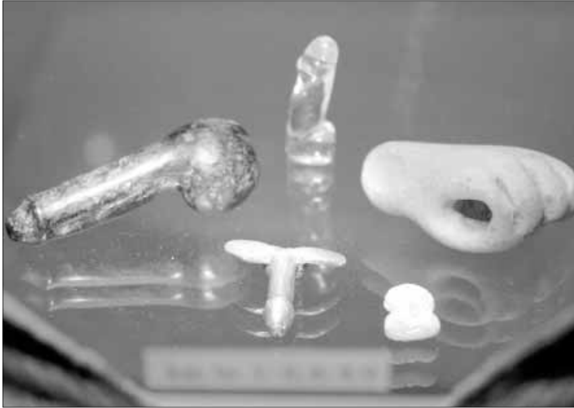
Simbolički falosi: Muški organi u erekciji

Amulete falosa jednako su nosili muškarci, žene i djeca. To su bili privjesci na odorama vojnika, žene su ih vješale na lančiću dok su im muževi bili u ratu, a tim amuletima darivana su novorođenčad. Postoje i kutijice s poklopcima na kojima je falos oblikovan u reljefu u kojima se čuvao ljubavni napitak, antička inačica današnje viagre. Teško