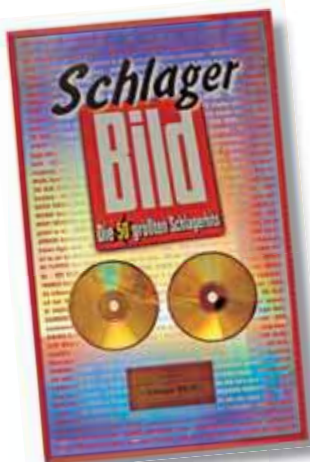
Nagrada za šlager sezone njemačkog časopisa »Bild«

M arta Robić donirala je gornjogradskom muzeju glazbenu ostavštinu svoga supruga koja će biti postavljena na izložbi 2007. godine