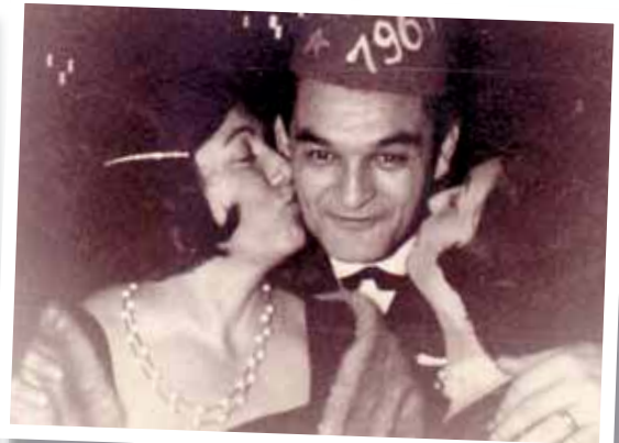
Pusa od supruge i prijateljice na Novu godinu 1961.