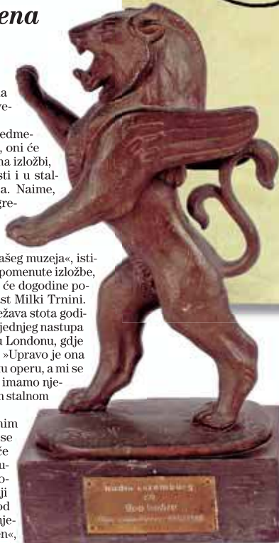
Jedna od nagrada Radija Luxembourg za sezonu 1959./60.