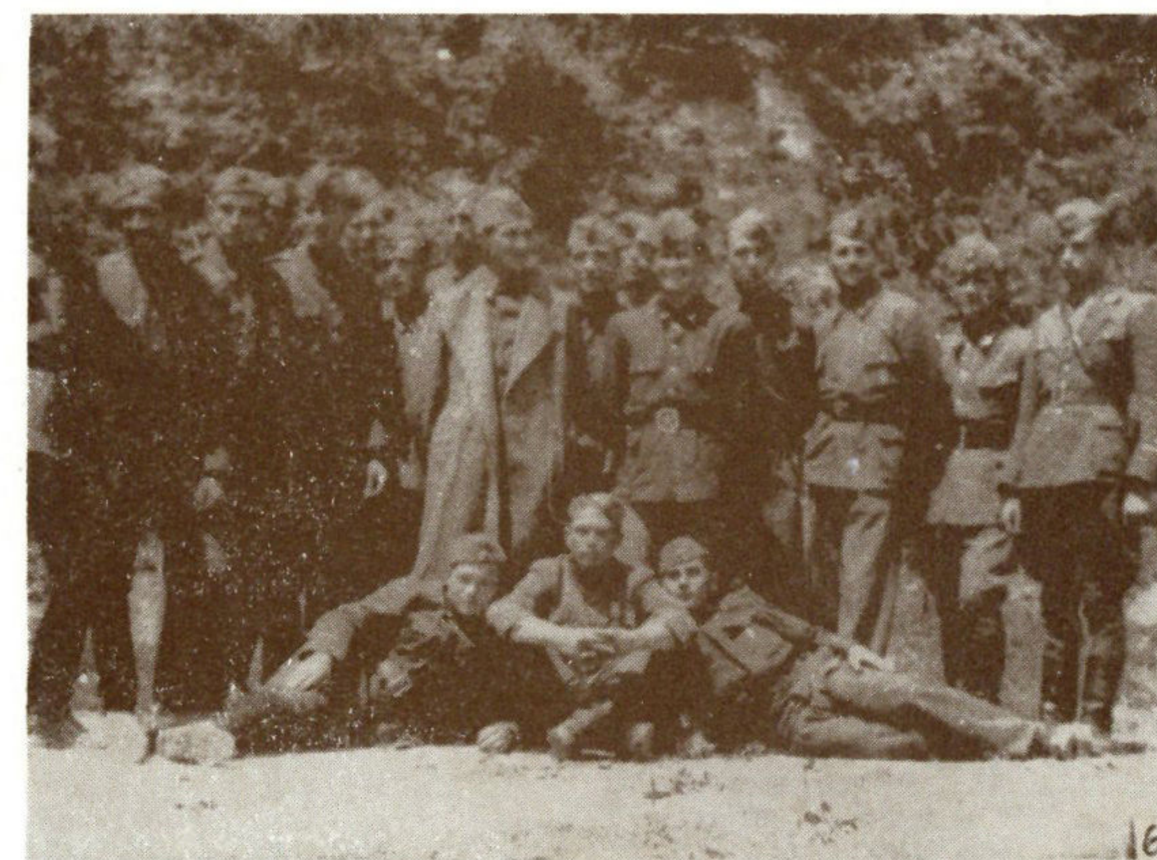
Brigada »Braće Radić« formirana je 4. septembra 1943. godine od četiri bataljona koji su imali 808 boraca, a neposredno poslije uspješnih akcija Kalničkog partizanskog odreda i 12. slavonske divizije na kazionu Lepoglava i neprijateljske jedinice u Zlataru i Jalkovcu kod Varaždina.