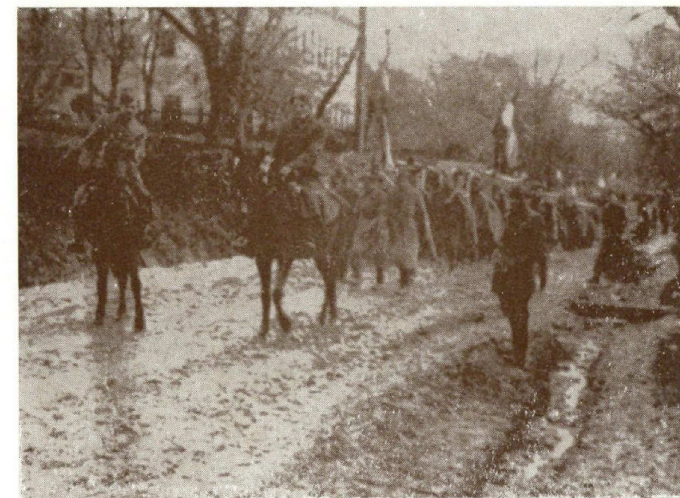
Nakon oslobođenja Ludbrega od neprijateljskih jedinica, formirana je 12. decembra 1943. godine brigada »Matija Gubec«. U brigadi je bilo 710 boraca razvrstanih u 3 bataljona.