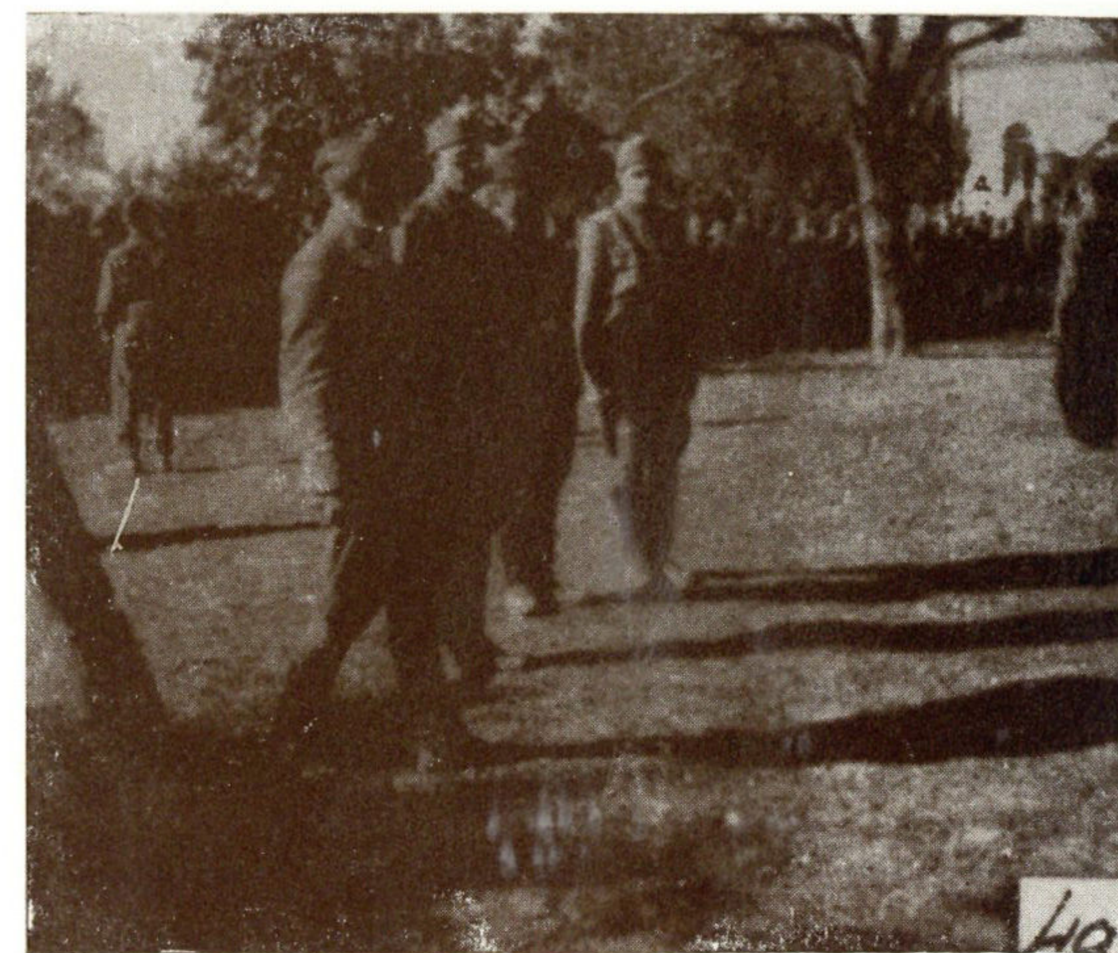
Štab X korpusa zagrebačkog na proslavi godišnjice 32. divizije 25. septembra 1944. godine u Kapeli