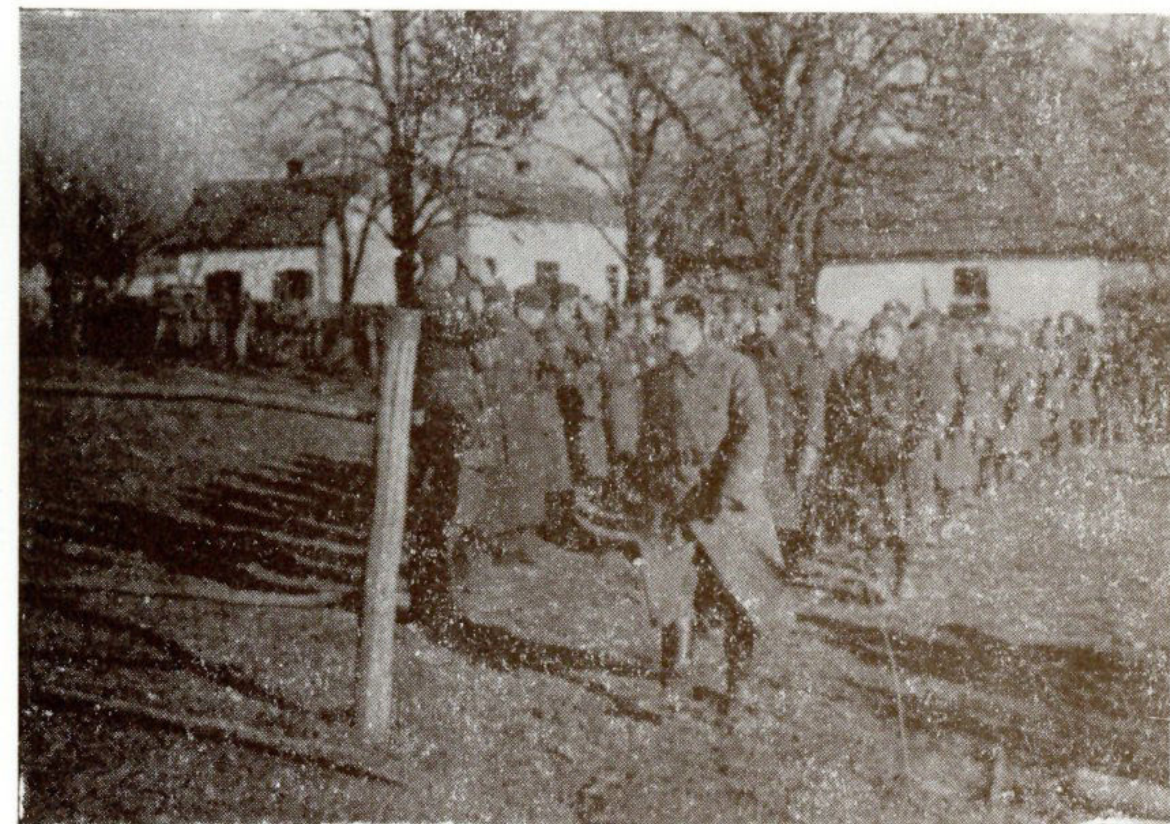
Povećanjem broja ljudstva u X korpusu zagrebačkom formirana je 10. maja 1944. godine Prva zagorska brigada, koja je imala tri bataljona.