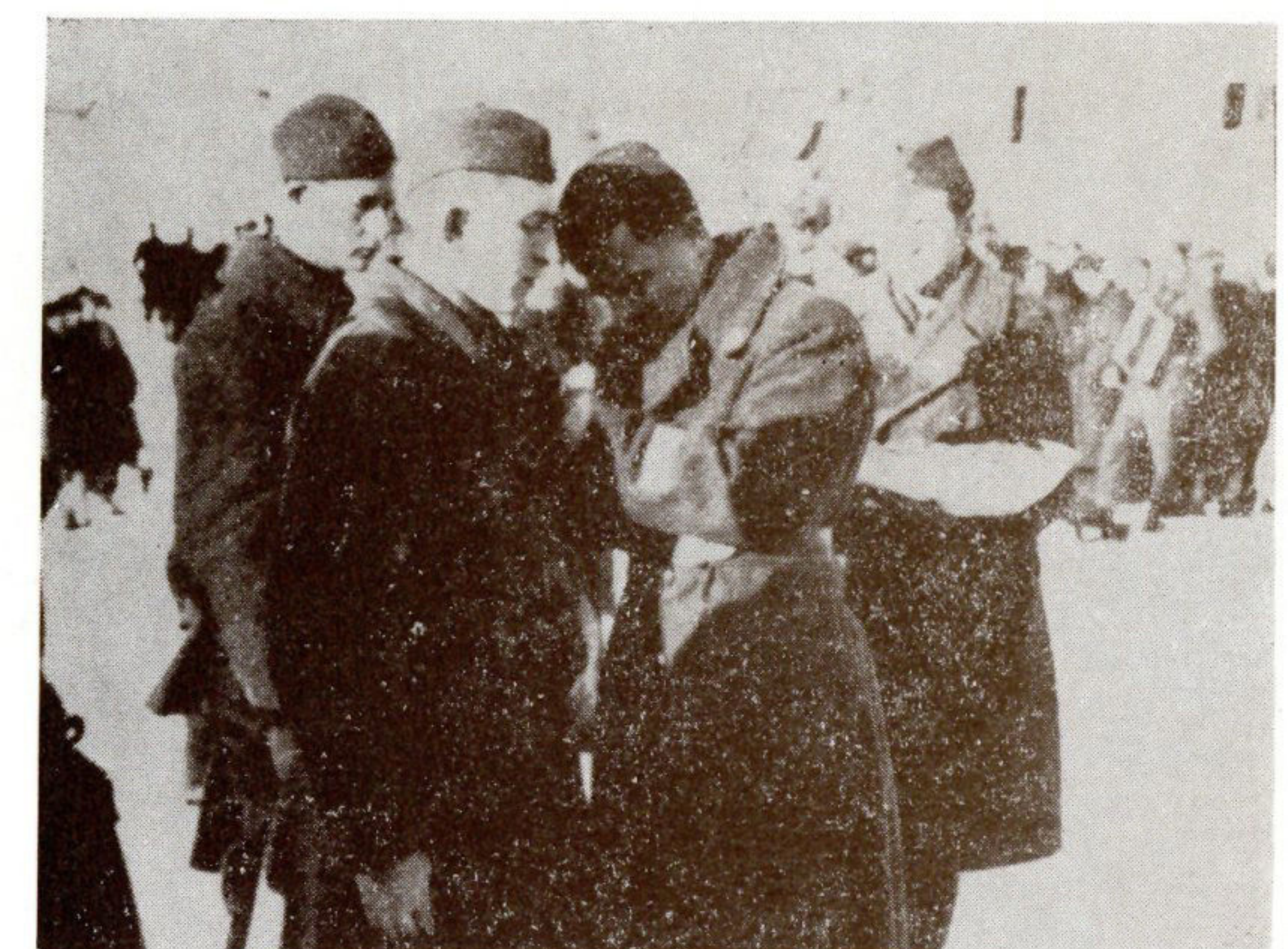
U rajonu Stare Straže 21. septembra 1943. godine formirana je Prva Moslavačka brigada, koja je 19. januara 1944. godine reorganizirana u Prvu i Drugu brigadu 33. divizije.

Virovitička brigada formirana je 26. augusta 1944. godine s četiri bataljona, a brigada »Pavleka Mihovil Miškine« formirana je 19. novembra 1944. godine.