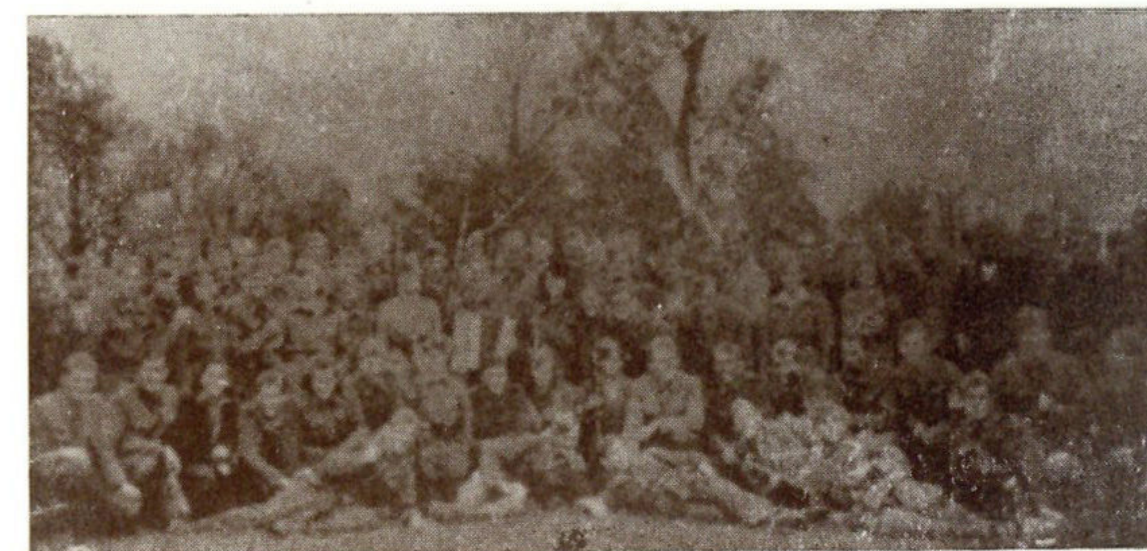
Vojni rukovodioci i vojnici 33. divizije