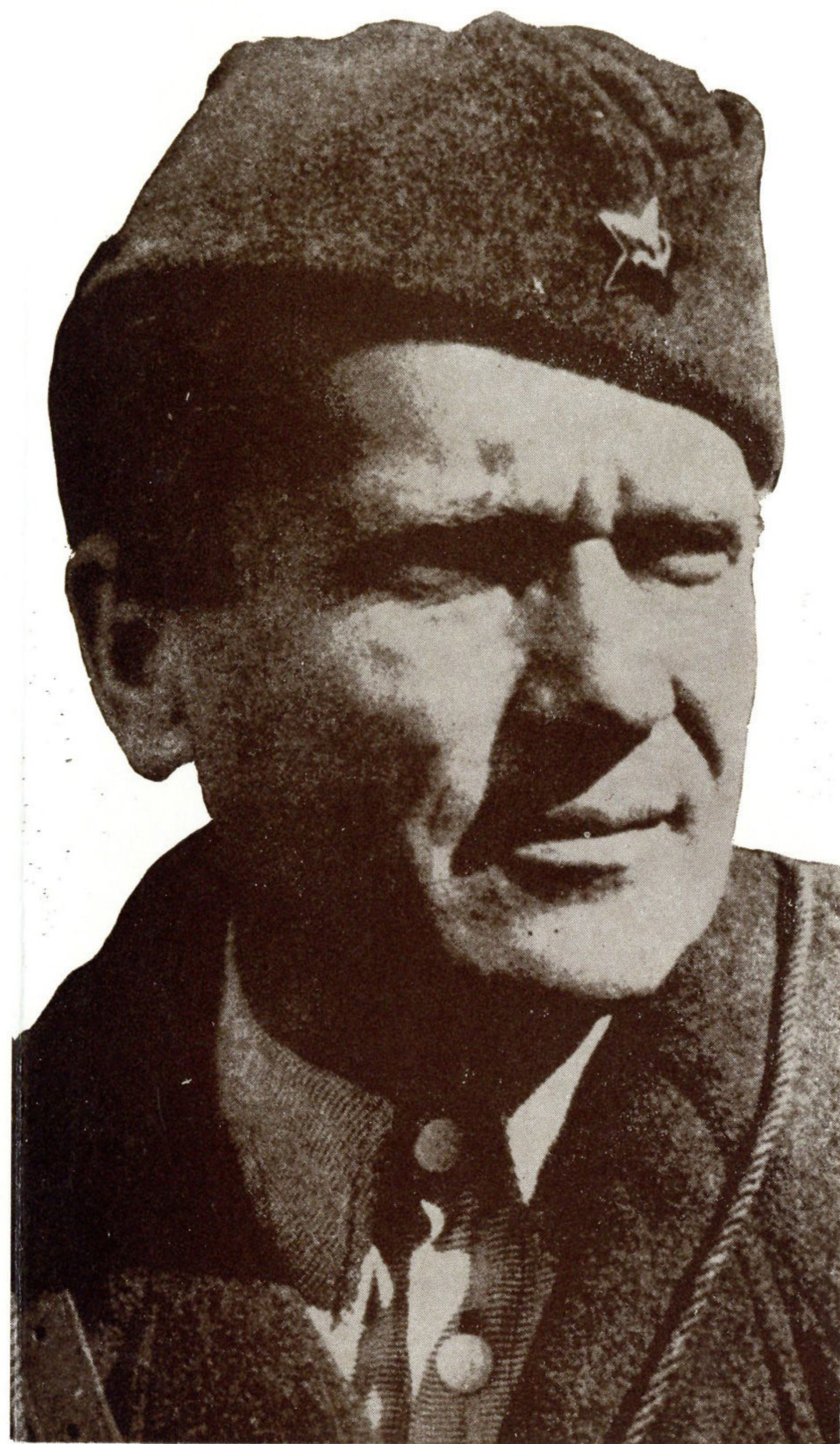
Josip Broz Tito

Naredbom VŠ NOV i POJ i GŠ NOV i POH formiran je 19. januara 1944. godine Deseti korpus zagrebački NOV i POJ. U sastavu X korpusa zagrebačkog NOV i POJ ušle su 32. i 33. divizija NOVJ, Zapadna grupa partizanskog odreda i Istočna grupa partizanskog odreda Hrvatske. Deseti zagrebački korpus pri formiranju imao je 6355 boraca i rukovodilaca u svojim vojnim formacijama. Formiranjem X zagrebačkog korpusa rasformirana je II operativna zona, a za rukovođenje partizanskim odredima formirani su štabovi Zapadne i Istočne grupe partizanskih odreda. Komanda Zapadne grupe odreda formirana je 19. januara 1944. godine, a Istočne grupe odreda 17. aprila 1944. godine u Moslavini. U sastav X korpusa ulazi kao samostalna operativna jedinica 3. diverzantski bataljon, koji je bio vezan uz Istočnu grupu partizanskih odreda.