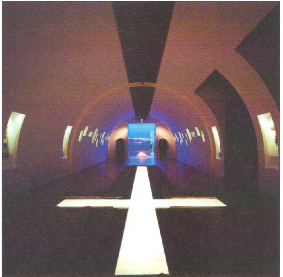
Kuća terora, Budimpešta (Mađarska), pogled u unutrašnjost

Pod direktorskom palicom osnivača i organizatora, entuzijasta, vizionara i uvaženog kolege, profesora muzeologije Tomislava Šole iz Zagreba, ova nadasve vrijedna manifestacija kojoj je cilj da se u Dubrovniku domaćoj i međunarodnoj javnosti i kolegama iz struke predstave najviša dostignuća u muzejskoj i konzervatorskoj struci — ponovno nam je pružila priliku upoznati se s visokim dostignućima dvadeset različitih projekata muzeja i institucija koje uglavnom ne spadaju među planetarno poznate svjetske muzeje, ali rade sjajne stvari, dokazujući da su muzeji i kulturna baština u cjelini stvarna kreativna snaga društva, jednako tako okrenuta prošlosti, kao i sadašnjosti i budućnosti, koja zna što želi učiniti s baštinom koju čuva i sakuplja, kako to učiniti i zbog čega. Vrsnoća je muzej puta komunikacija na kvadrat , bio je moto ovogodišnje manifestacije. I doista o kommunikaciji je bilo najviše govora, bilo kroz predavanja, bilo u diskusijama sudionika. Učiniti muzeje živim mjestima ( living places ) bila je krilatica mnogih predstavljača koji su to uspješno dokazivali primjerima iz vlastitih sredina: Muzej zdravlja Trakyaskog sveučilišta za brigu o zdravlju kao sastavni dio Kompleksa sultana Bayezida II. u Edirni, Turska; Satelitski muzej — Muzej beduinske kulture u Centru Joe Alon u Negevu, Izrael; Muzej Kuća terora ( »The House of Terror« ) u Budimpešti, Mađarska, Pomorski muzej »Sergej