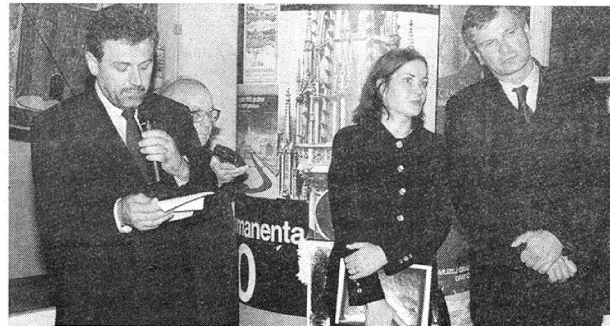
Dan Budimpešte u Zagrebu – otvorenje izložbe u Muzeju Grada Zagreba