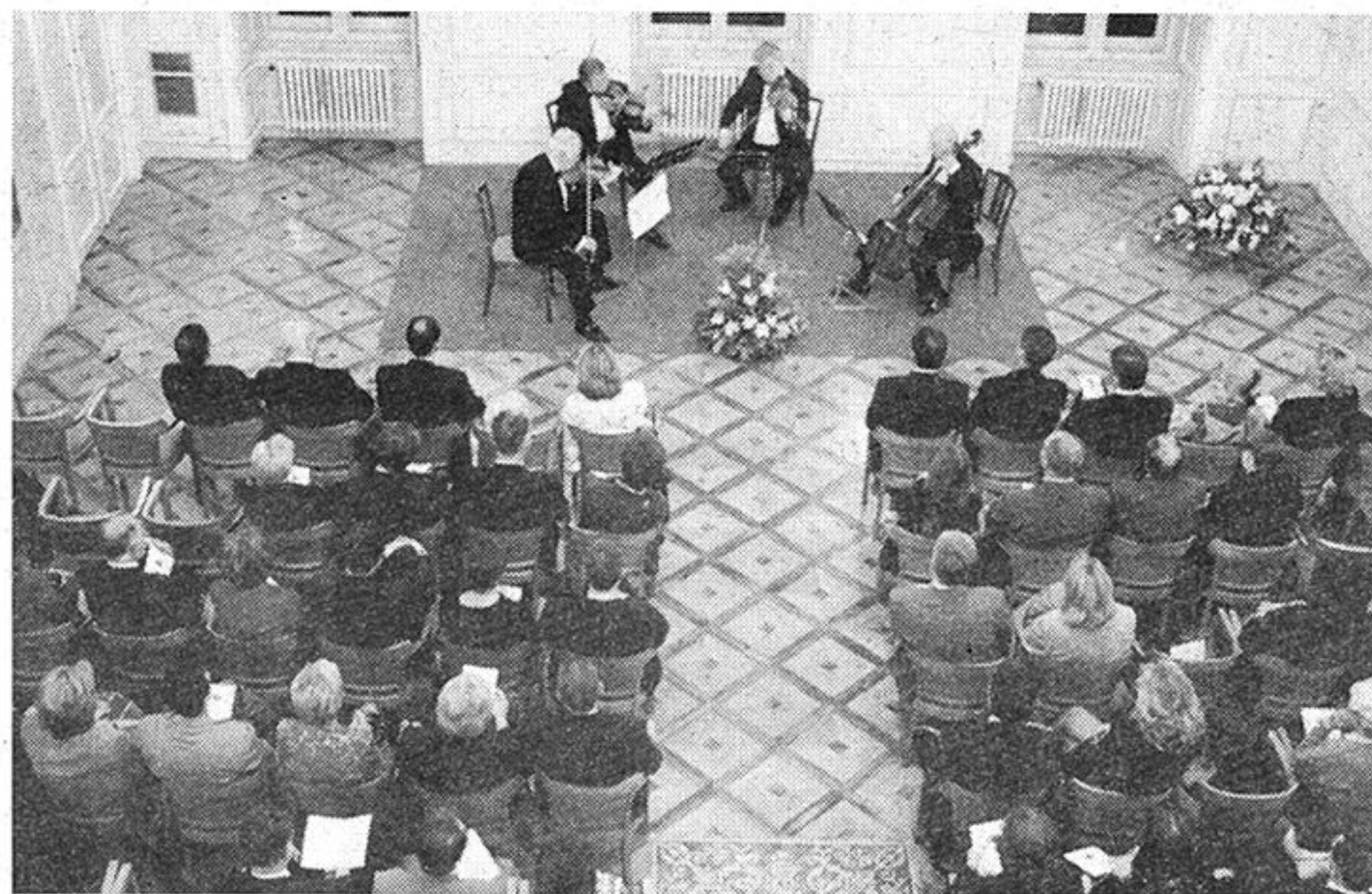
Koncert kvarteta Bartok