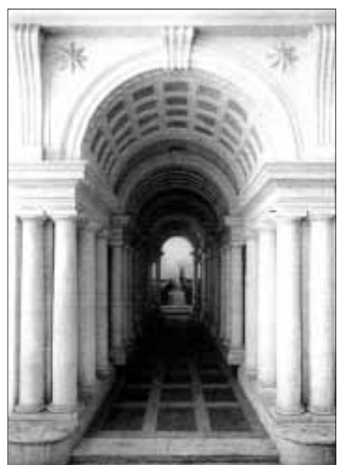
Iluzionistička perspektiva: Borrominijev hodnik u palači Spada