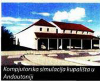
Kompjutorska simulacija kupališta u Andautoniji