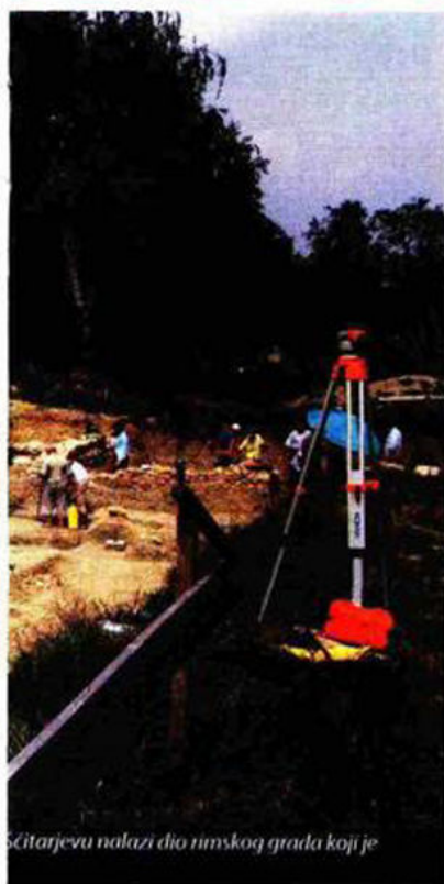
Ščitarjevu nalazi dio rimskog grada koji je