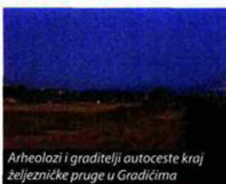
Arheolozi i graditelji autoceste kraj željezničke pruge u Gradičima