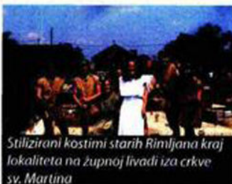
Stilizirani kostimi starih Rimljana kraj lokaliteta na župnoj livadi iza crkve sv. Martina

prvih pokazatelja da je riječ o vrijednom nalazištu? Jer, razmišljanja su znalaca: kako je ovo jedan od 4-5 centara urbane rimske kulture u panonskom dijelu Hrvatske, bilo je jasno da će se na tom mjestu nešto značajnije pronaći i nije se smjelo krenuti u gradnju, pa onda tražiti istraživanja. Napokon, pojašnjavaju nam sugovornici: na ovom i sličnim lokalitetima, gdje su prethodna istraživanja indicirala nalazište, i za gradnju obiteljske kuće morate zatražiti dozvolu od Ministarstva kulture, uz obavezno mišljenje struke, te kasnije nadzor arheologa.