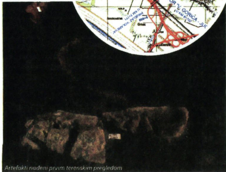
Artefakti nađeni prvim terenskim pregledom

Velikoj Mlaki spajati na postojeću brzu cestu Zagreb – Velika Gorica. A postojeća prometnica, tj. prijelaz preko željezničke pruge na kraju Kolodvorske ulice, u završnoj se fazi izgradnje zatvara. Pješački pothodnik bit će izgrađen stotinjak metara sjevernije, a promet automobila i drugih vozila ići će preko paralelne prometnice uz autocestu.