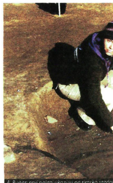
A. Buqar: prvi nalazi ukazuju na rimsko razdoblje

Naši su reporteri, dakako, odmah otišli na teren i snimili prve nalaze. No, za neku detaljniju informaciju o obimu i vrijednosti nalazišta još je prerano govoriti – kazaše nam stručnjaci. Ipak, dojam je laika kako je riječ o još jednom rimskom nalazištu, kakvih, napokon, u ovim našim krajevima imade sijaset.