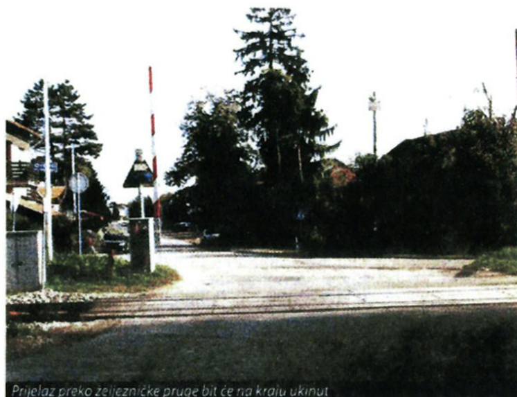
Prijelaz preko željezničke pruge bit će na kraju ukinut