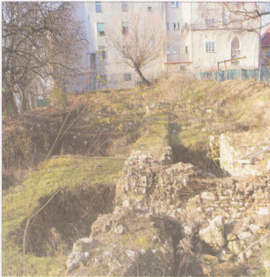
Pogled s kule Lotrščak na istraženi dio Vranicanijeve poljane

GORNJI GRAD Dosad senzacionalna otkrića - a ovog proljeća kreću arheološka istraživanja na novim lokalitetima