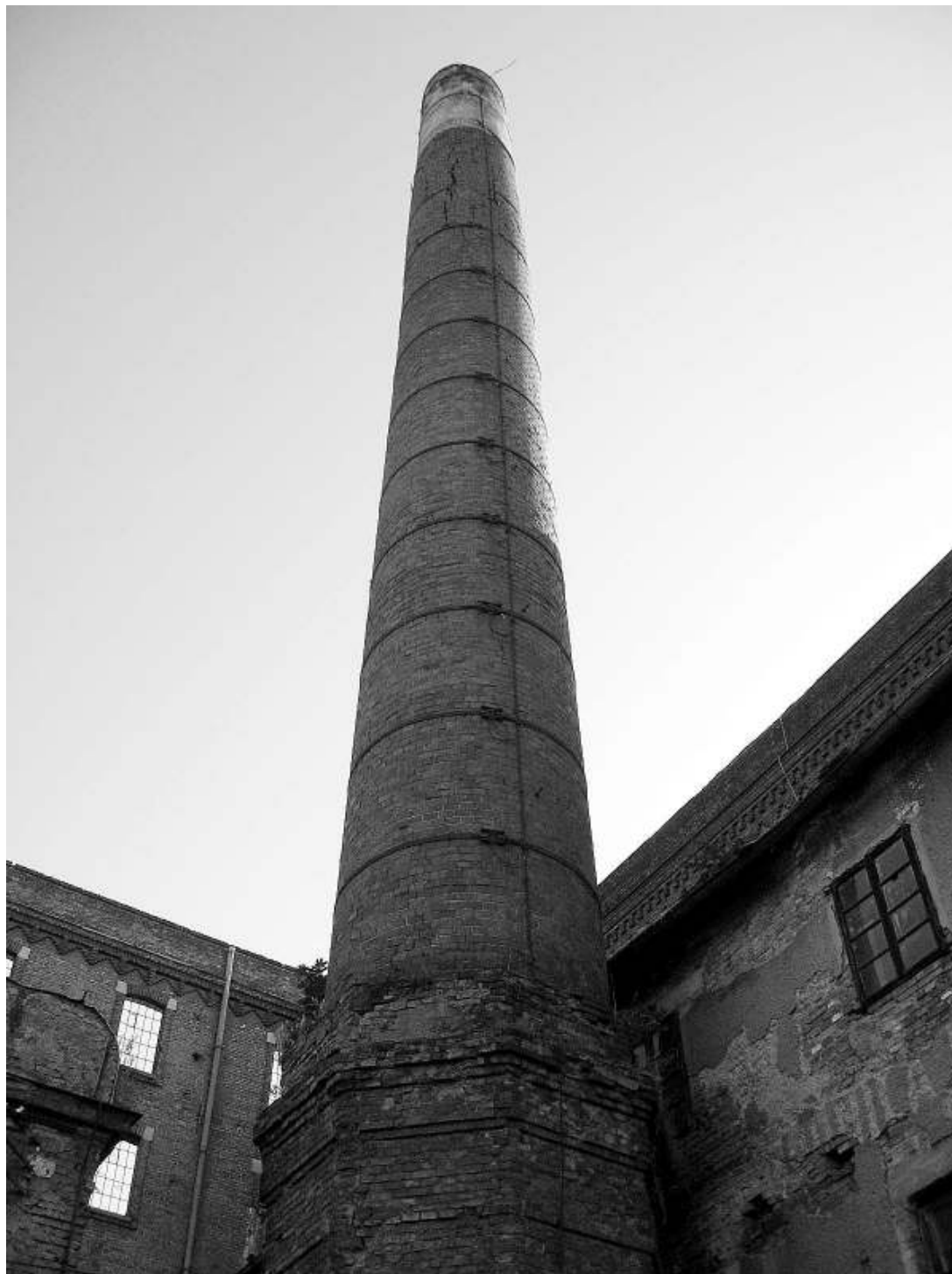
sl. 11. Pogled na paromlinski dimnjak, 2008.

The main problem inheres in the lack of awareness of the need to preserve the industrial heritage and of ideas about its development potentials, from which derives a shortage of interest and concrete ideas. Early industrial structures in the city of Zagreb on the whole are located on attractive sites and financial interests are often way ahead of heritage concerns, which is aided by the economic logic in thinking about their future and the traditional way of perceiving culture. This kind of approach must necessarily be changed and reassessed, for otherwise there is likely to be a total