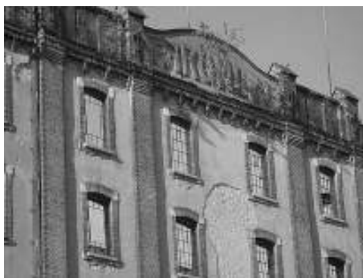
sl. 2. Ostaci Paromlina, 2007.