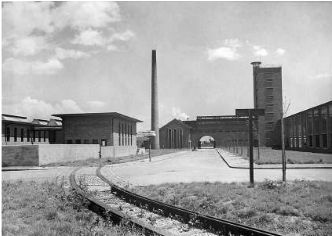
sl. 6. Gradska klaonica, 1931.