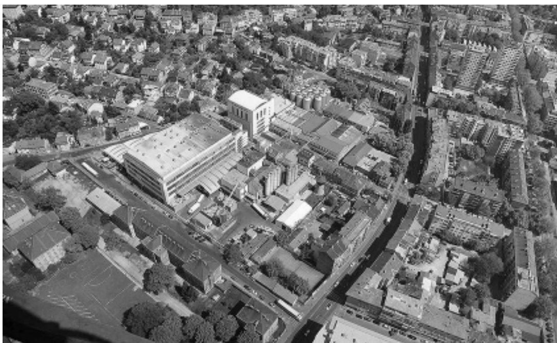
sl. 10. Kompleks Zagrebačke pivovare, 2007.

multidisciplinarni pristup, kojemu u prikazu nacionalne, regionalne ili lokalne povijesti posljednjih godina pribjegavaju muzejske ustanove u Europi, Hrvatski povijesni muzej povećao bi kvalitetu i kompleksnost prezentacije te nametnuo nužno potreban novi odnos prema vrednovanju i shvaćanju industrijske baštine kao kulturnog resursa. 17