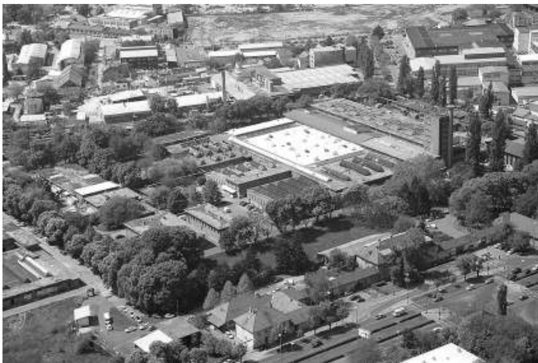
sl. 7.- 8. Kompleks Zagrepčanka (nekadašnja Gradska klaonica), 2007.