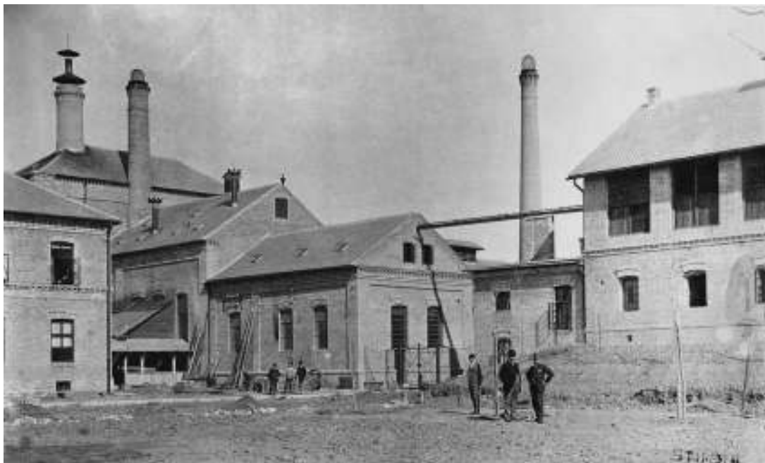
sl. 9. Zagrebačka pivovara u vrijeme izgradnje, 1892.